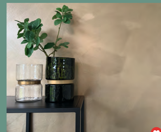
@decodentity #cosyliving #antigriffes #MetallicChicBrush #LuxuriousRust #luxe #travaildepro