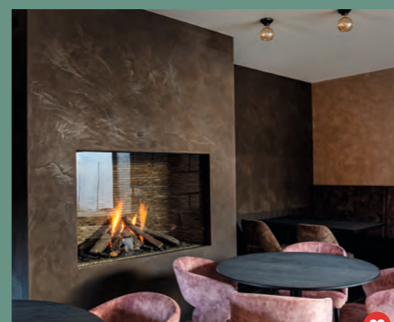
Schilder- & decoratiewerken JPS #BrasserieM #stucdechaux #CalcoOriginal #100%ambiance #WarmGravel #ELJadida #effetwaouw