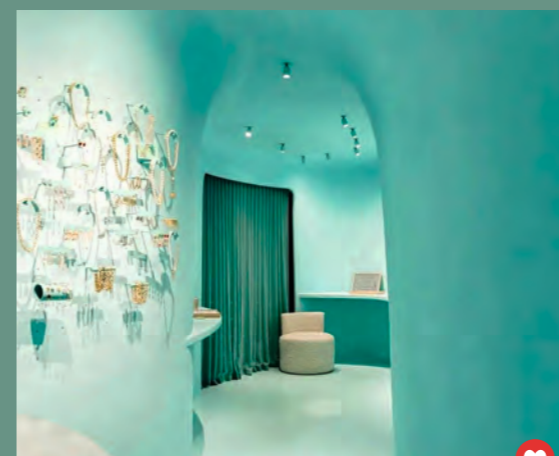
@perfix_schilderwerken #bijou #Claystuc #couleursurmesure #savoirfaire #stucdeco #impressionnant #fierpartenaire