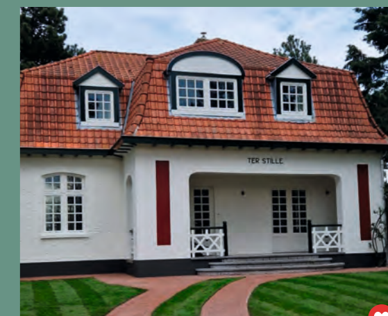
@eric.finaut #mer #patrimoineflamand #SolSilicatPrim #SolSilicatMur #ElastosatinXS #Sublimat #grandeclasse