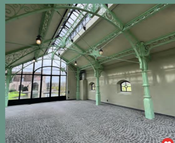
@schildersbedrijfvanhecke.be #orangerie #Tusk #BossOneMat #HybridePUSatin #beauboulot #resistant #antigriffes #tourdeforce

Nos spotters sur les réseaux sociaux sont toujours à l'affût de belles réalisations. Suivez-nous sur Instagram via @bosspaints_be_fr et sur Facebook via @BOSSpaintsprofessionnel , taguez-nous dans vos photos et récits, ou utilisez le hashtag général #bosspaints dans vos posts sur les réseaux sociaux. Qui sait, votre travail sera peut-être repéré !