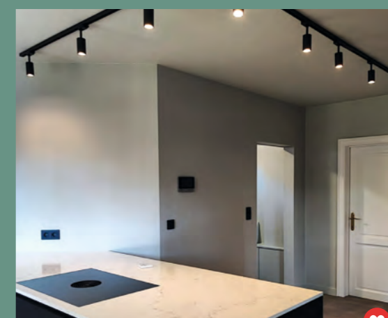
@cristiaensen #Bossprim #BossflowMat #SeaSaltGreen #WhiteBlur #ElastosatinHydro #PersistoPUMat #OmniprimExtreme