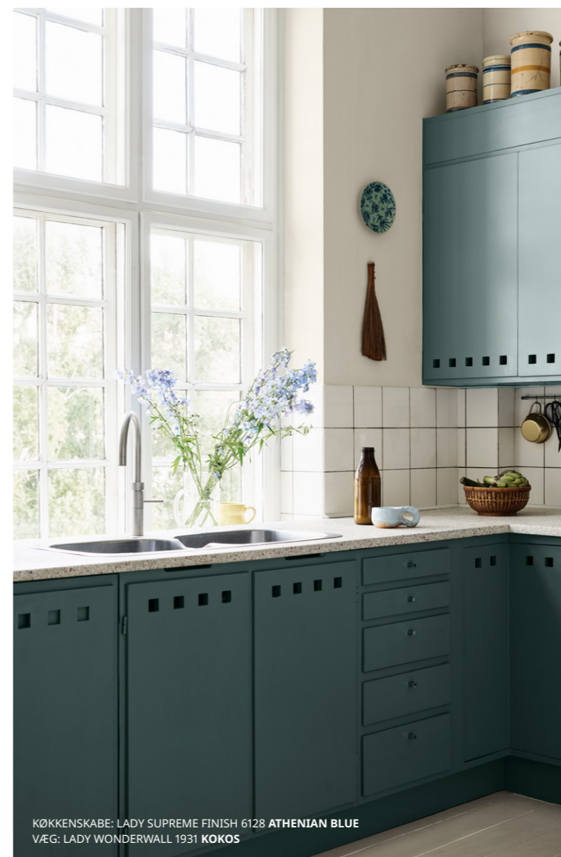
KØKKENSKABE: LADY SUPREME FINISH 6128 ATHENIAN BLUE VÆG: LADY WONDERWALL 1931 KOKOS