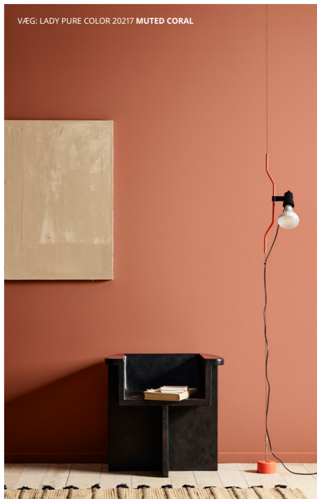
VÆG: LADY PURE COLOR 20217 MUTED CORAL