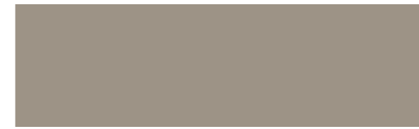
LADY PURE COLOR 11130 SHADE +□