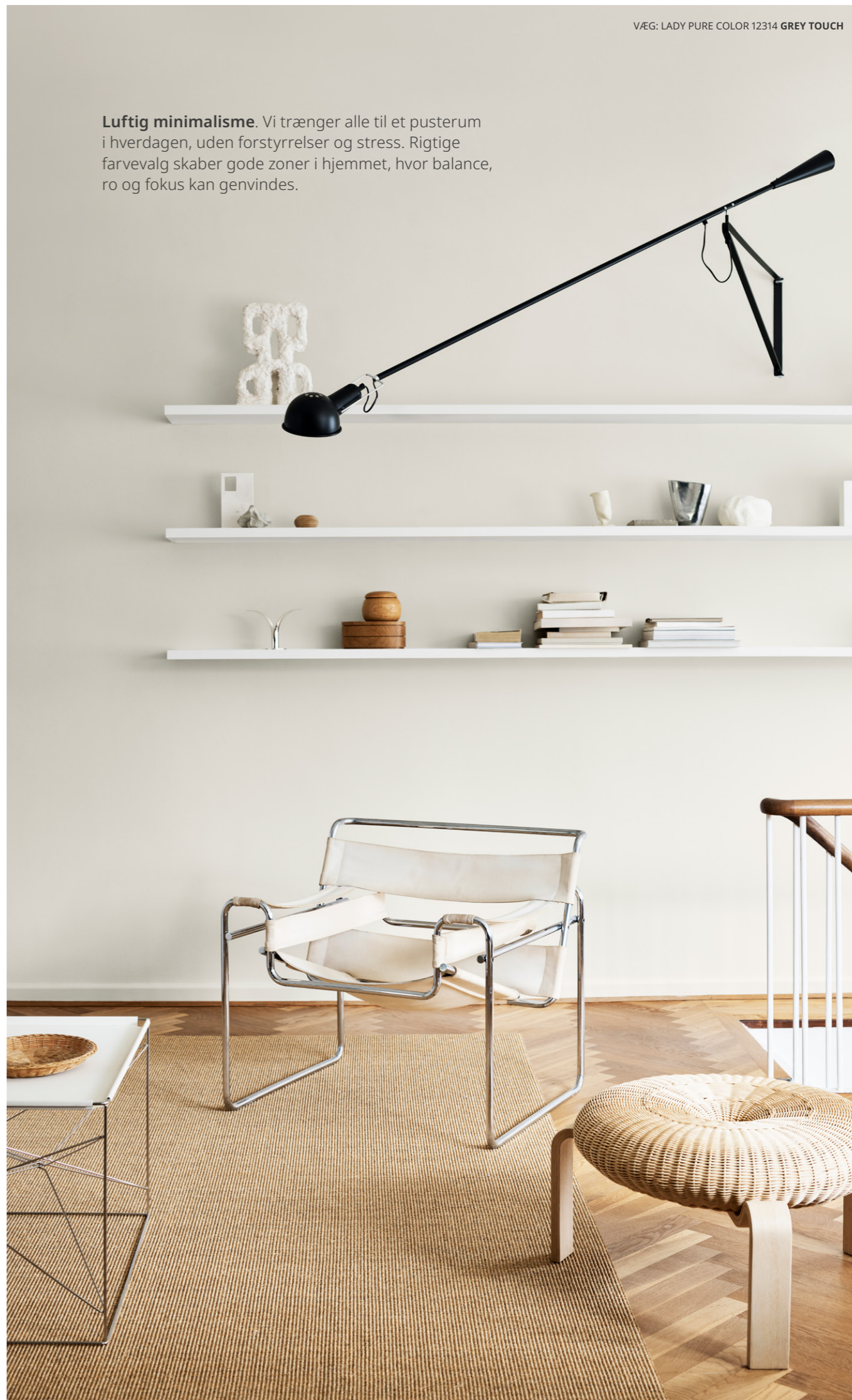
VÆG: LADY PURE COLOR 12314 GREY TOUCH

Luftig minimalisme. Vi trænger alle til et pusterum i hverdagen, uden forstyrrelser og stress. Rigtige farvevalg skaber gode zoner i hjemmet, hvor balance, ro og fokus kan genvindes.