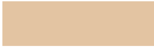
LADY PURE COLOR 10411 SHAMS