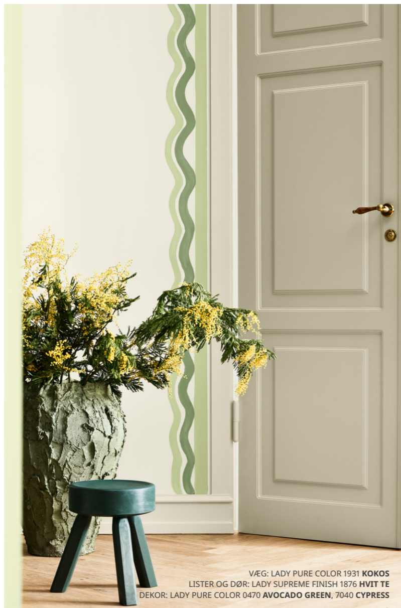
VÆG: LADY PURE COLOR 1931 KOKOS LISTER OG DØR: LADY SUPREME FINISH 1876 HVIT TE DEKOR: LADY PURE COLOR 0470 AVOCADO GREEN, 7040 CYPRESS