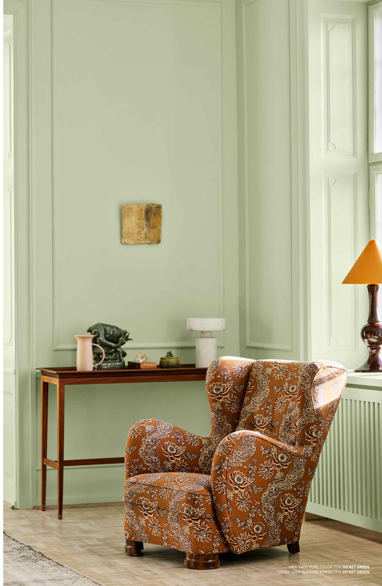
VÆG: LADY PURE COLOR 7718 SECRET GREEN LISTER: LADY SUPREME FINISH 7718 SECRET GREEN

I det øjeblik , du træder ind i et rum, vil sansernes møde med omgivelserne definere din oplevelse af rummet. Dæmpede, neutrale farver og lyse, naturlige, grønne farver virker både opfriskende og beroligende. Samtidig giver de plads til mere leg, dristige accentfarver og unikke interiørobjekter. Baggrunden sætter rytmen, forgrunden bærer tonen.