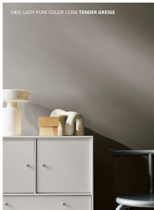
VÆG: LADY PURE COLOR 12306 TENDER GREIGE