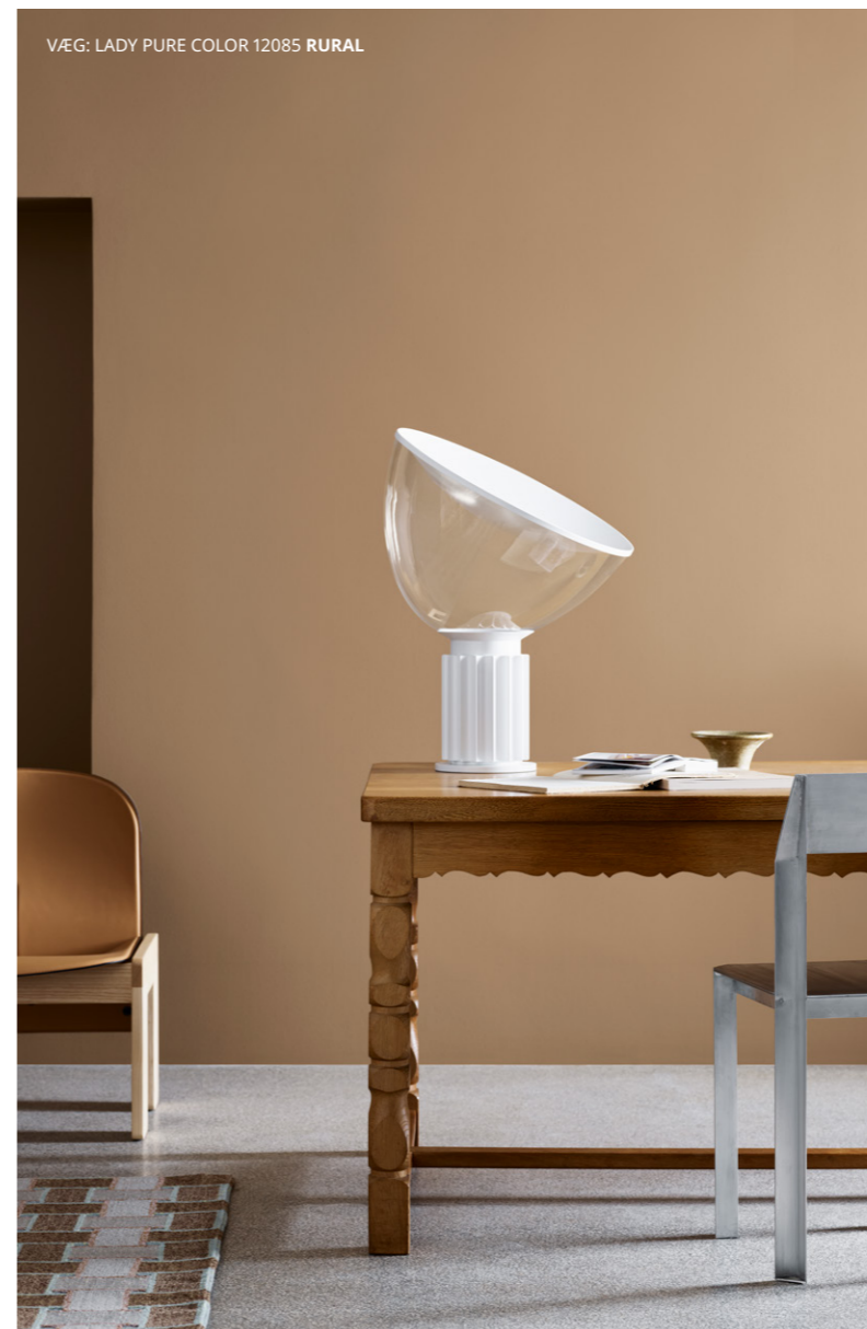
VÆG: LADY PURE COLOR 12085 RURAL