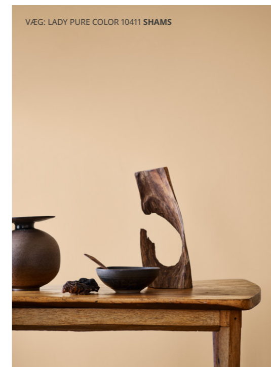
VÆG: LADY PURE COLOR 10411 SHAMS

LADY Pure Color – unik farveoplevelse med et eksklusivt, supermat udseende