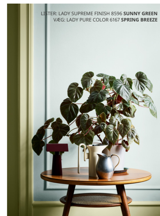
LISTER: LADY SUPREME FINISH 8596 SUNNY GREEN VÆG: LADY PURE COLOR 6167 SPRING BREEZE