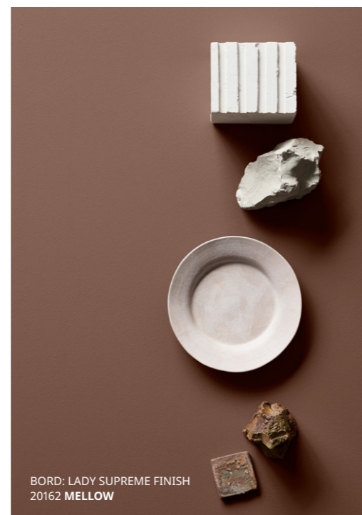
BORD: LADY SUPREME FINISH 20162 MELLOW

Beige nuancer fylder rum med varme og blødhed – ideelt i soverum og værelser beregnet til komfort og afslapning.