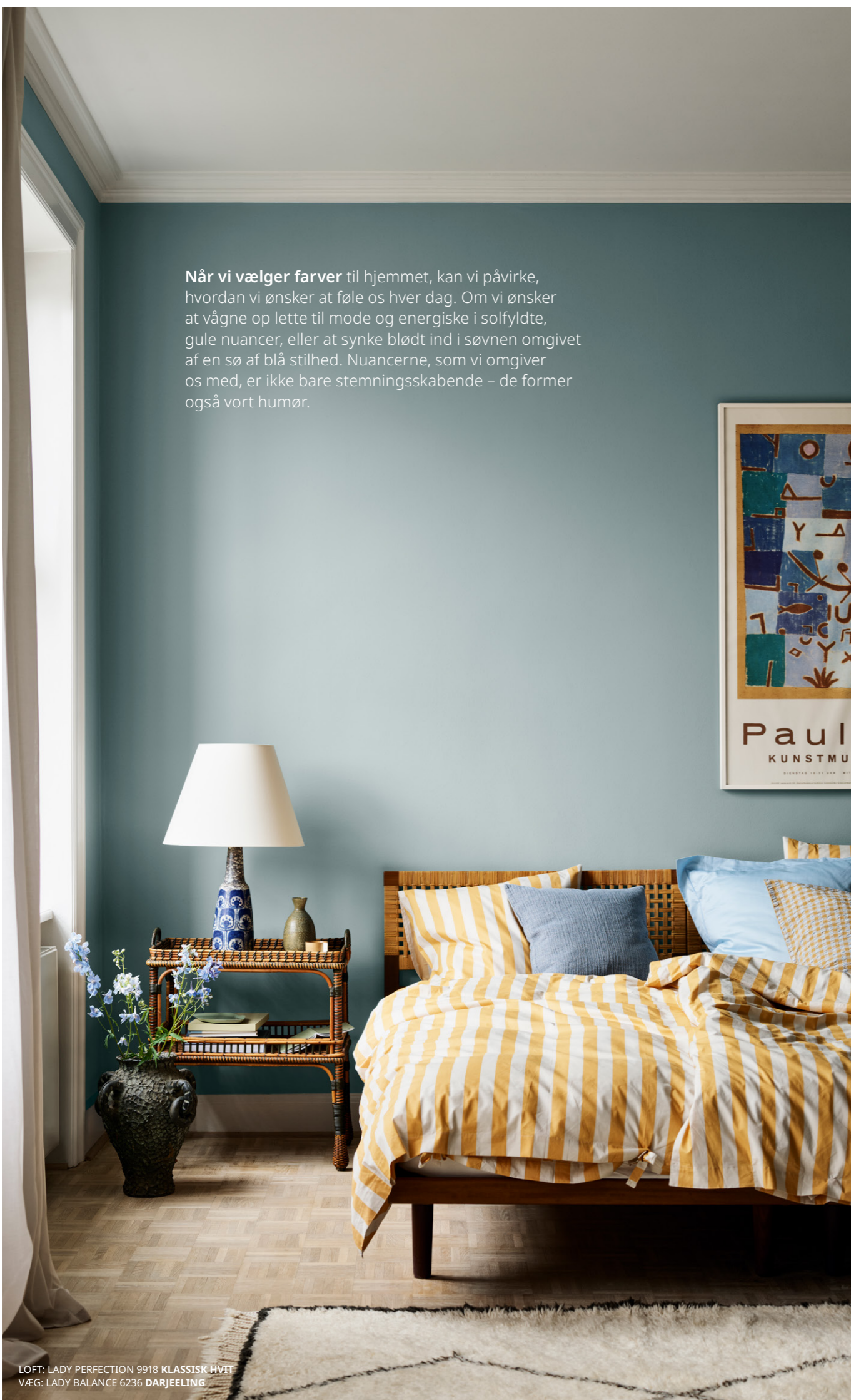
LOFT: LADY PERFECTION 9918 KLASSISK HVIT VÆG: LADY BALANCE 6236 DARJEELING