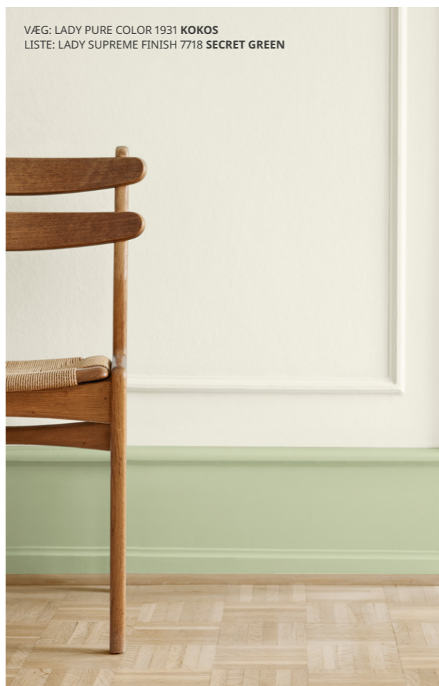
VÆG: LADY PURE COLOR 1931 KOKOS LISTE: LADY SUPREME FINISH 7718 SECRET GREEN

I det øjeblik , du træder ind i et rum, vil sansernes møde med omgivelserne definere din oplevelse af rummet. Dæmpede, neutrale farver og lyse, naturlige, grønne farver virker både opfriskende og beroligende. Samtidig giver de plads til mere leg, dristige accentfarver og unikke interiørobjekter. Baggrunden sætter rytmen, forgrunden bærer tonen.