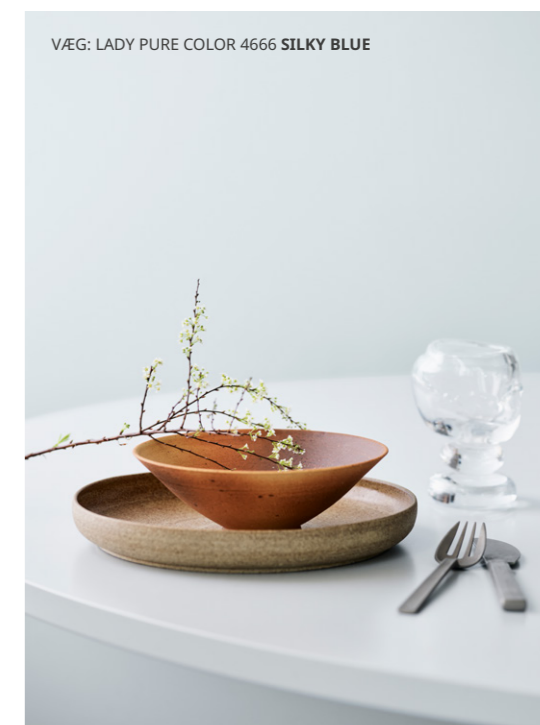
VÆG: LADY PURE COLOR 4666 SILKY BLUE

Rustikke, rosa nuancer, fersken, koral og terrakotta kan fylde hjemmet med en følelse af jordnær stabilitet – gennemtænkt, elegant og uprætentiøst.