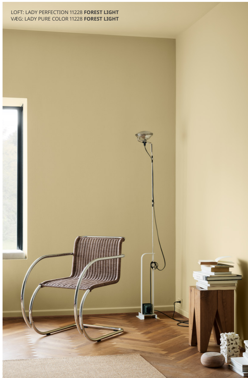
LOFT: LADY PERFECTION 11228 FOREST LIGHT VÆG: LADY PURE COLOR 11228 FOREST LIGHT

Lag på lag. Som en tone spillet i en anden oktav, kan en enkelt farve skabe et uendeligt stort anvendelsesrum, når den anvendes i forskellige grader af intensitet.