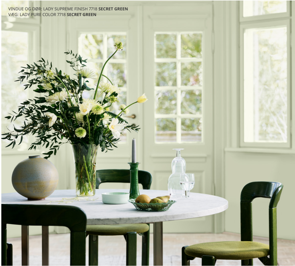
VINDUE OG DØR: LADY SUPREME FINISH 7718 SECRET GREEN VÆG: LADY PURE COLOR 7718 SECRET GREEN