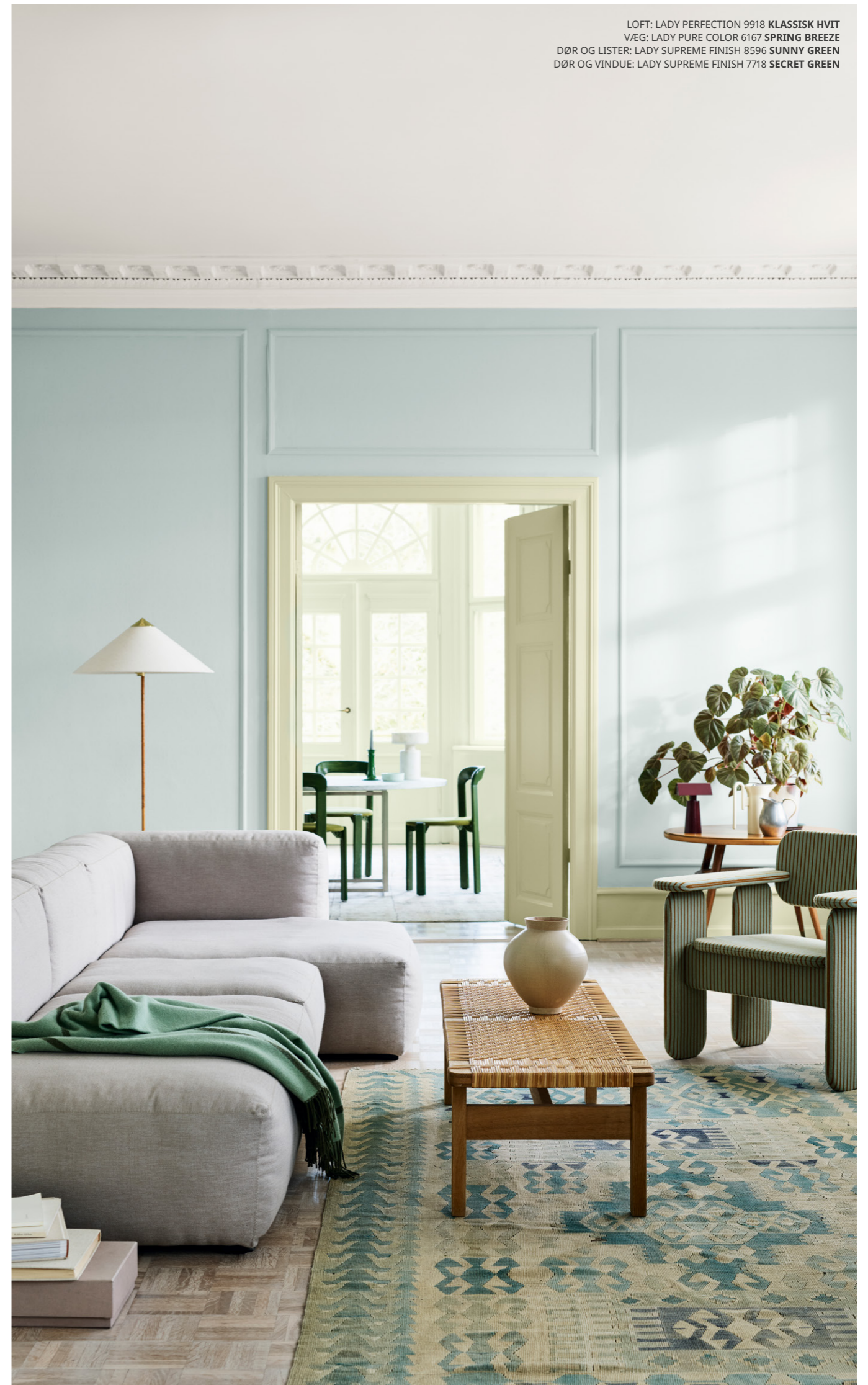
LOFT: LADY PERFECTION 9918 KLASSISK HVIT VÆG: LADY PURE COLOR 6167 SPRING BREEZE DØR OG LISTER: LADY SUPREME FINISH 8596 SUNNY GREEN DØR OG VINDUE: LADY SUPREME FINISH 7718 SECRET GREEN

LADY Supreme Finish – giver perfekt finish til træ og lister, i fire forskellige glansgrader