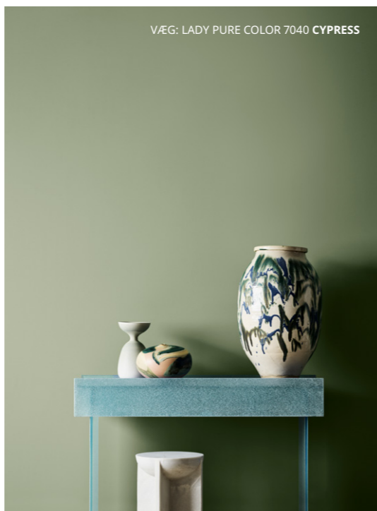
VÆG: LADY PURE COLOR 7040 CYPRESS

Naturen har et uendeligt bibliotek af nuancer. Ved at kombinere stærke, grønne accentfarver og bløde, mere dæmpede toner på vægge, møbler og interiør, genskabes naturens skønhed indendørs. Tilføj subtile anstrøg af blå og fremkald stemningen af himmel og hav.