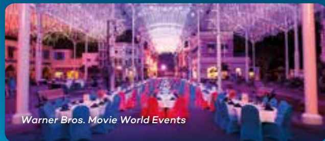
Warner Bros. Movie World Events