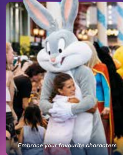
Embrace your favourite characters