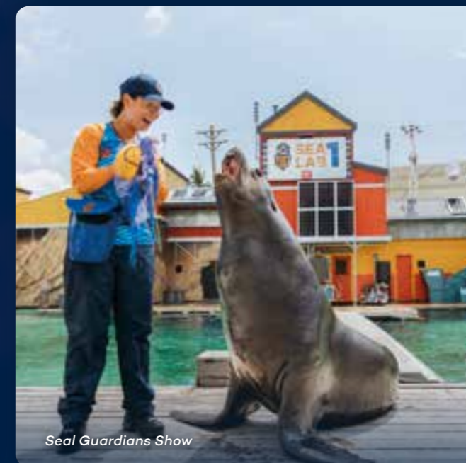
Seal Guardians Show