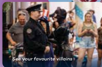
See your favourite villains