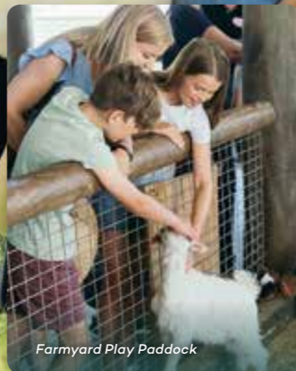
Farmyard Play Paddock