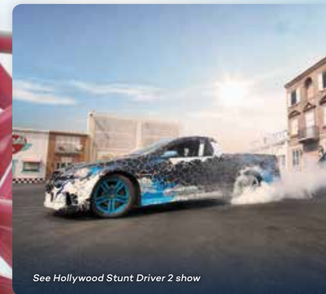
See Hollywood Stunt Driver 2 show