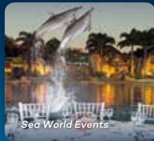
Sea World Events

8つのエキサイティングなパーク会場で、想像力をふくらませてこれまでにないテーマを。ビレッジ・ロードショー・テーマパークはあなたの次のイベントをきっと感動的な体験に変えてくれるでしょう。