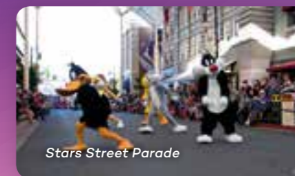
Stars Street Parade