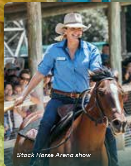
Stock Horse Arena show