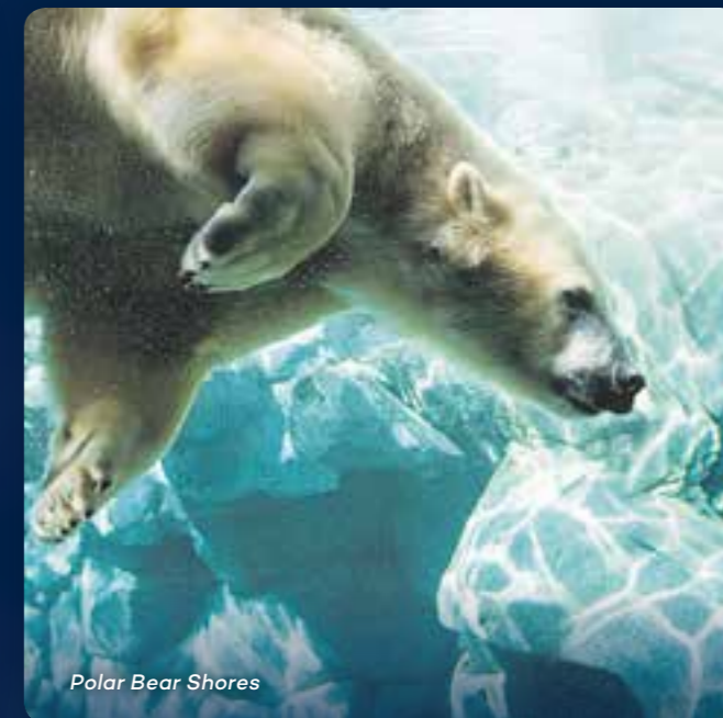
Polar Bear Shores