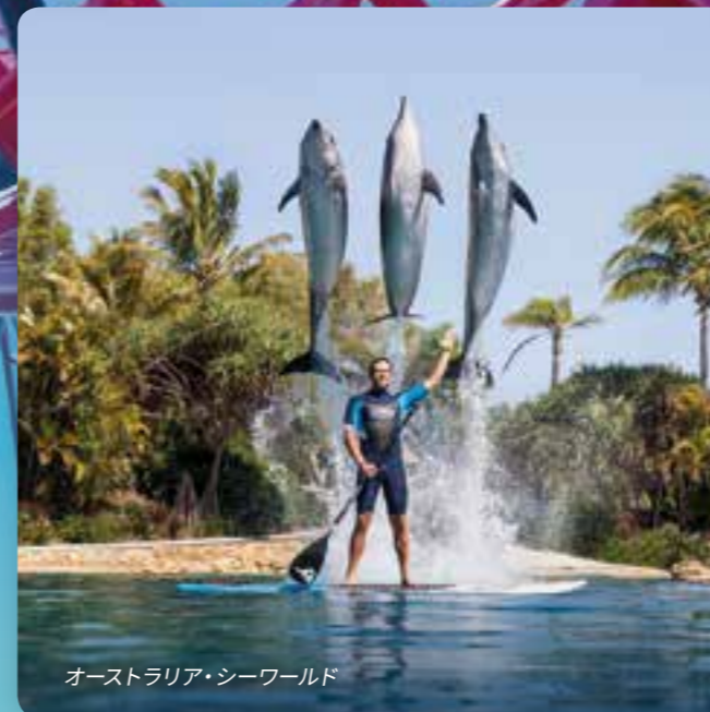
オーストラリア・シーワールド