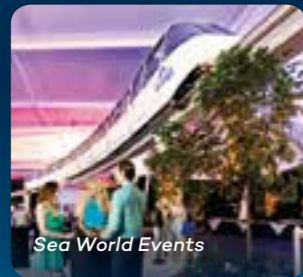
Sea World Events