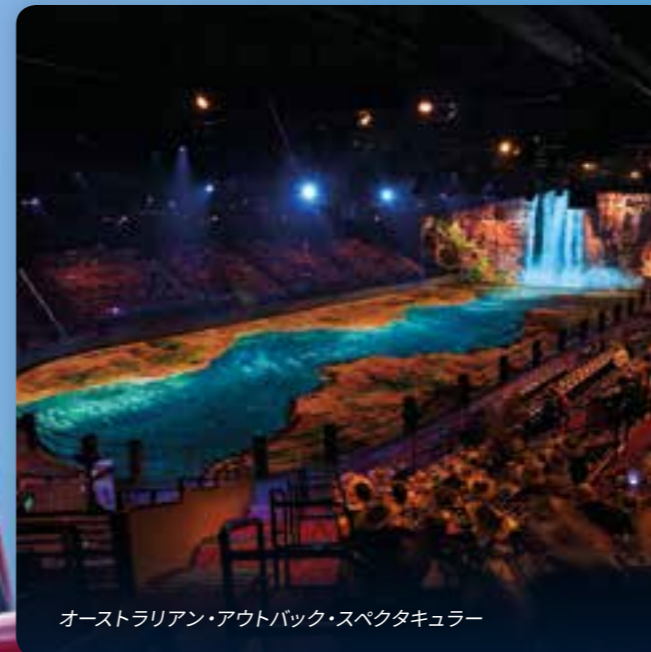
オーストラリアン・アウトバック・スペクタキュラー