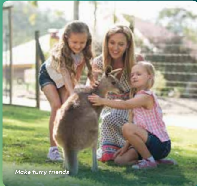
Make furry friends