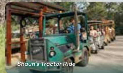
Shaun's Tractor Ride