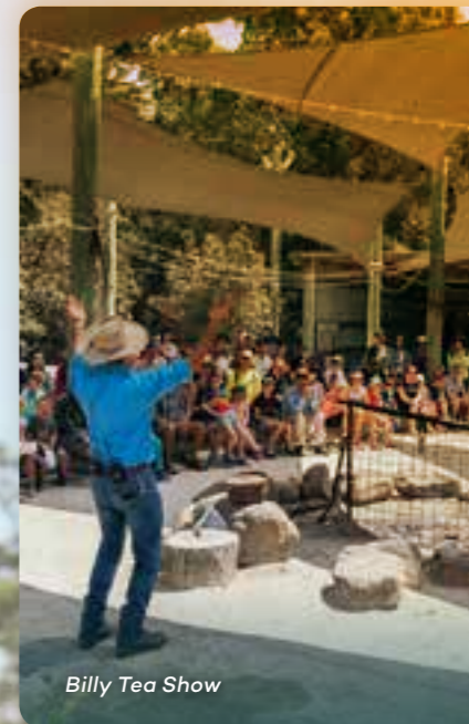
Billy Tea Show