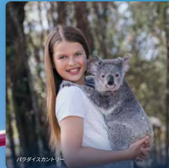
パラダイスカントリー