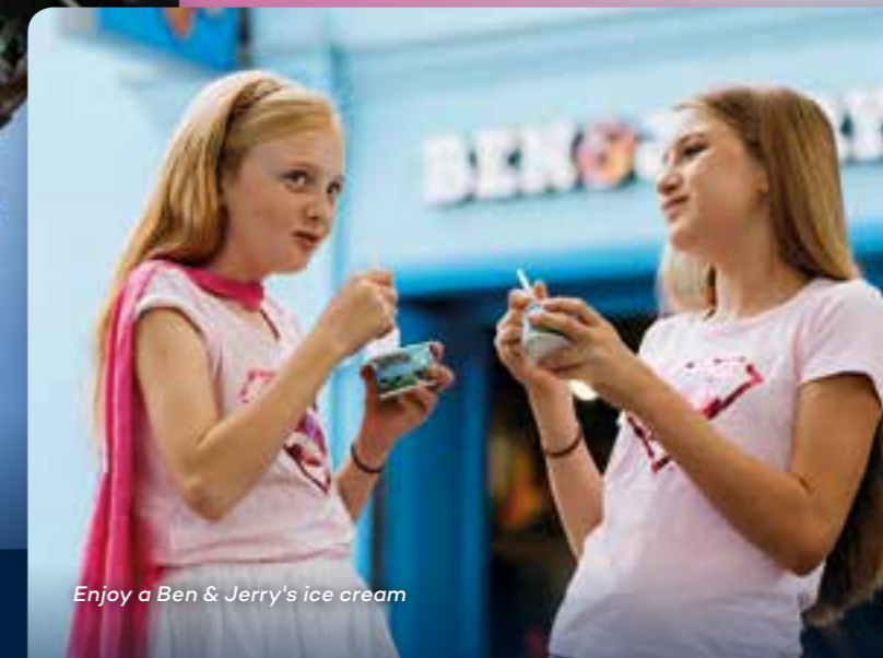
Enjoy a Ben & Jerry's ice cream