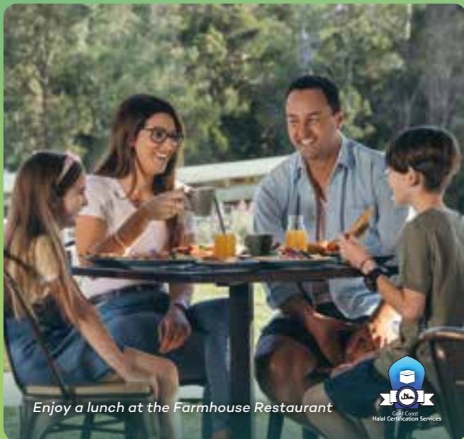
Enjoy a lunch at the Farmhouse Restaurant