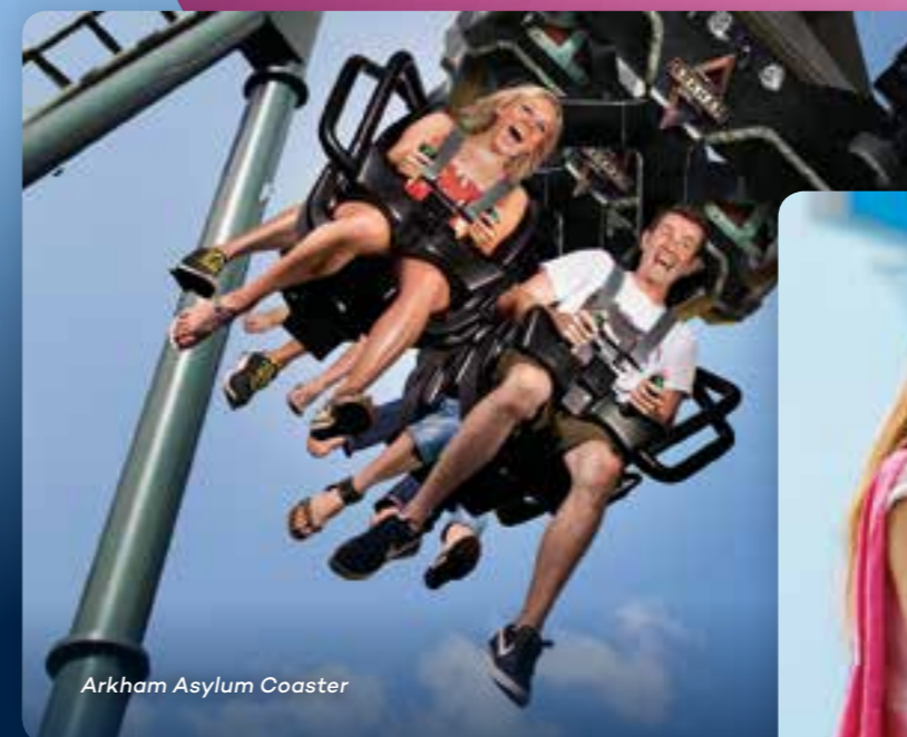
Arkham Asylum Coaster