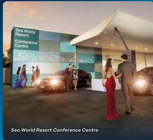
Sea World Resort Conference Centre