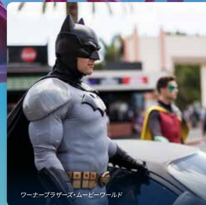
ワーナーブラザーズ・ムービーワールド