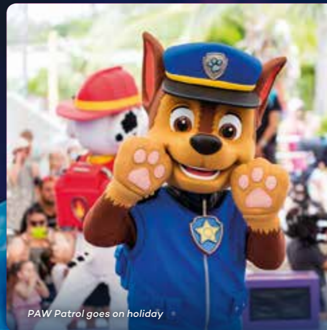
PAW Patrol goes on holiday

海外からの学生の皆様は、オーストラリア・シーワールドでは魅惑の海洋哺乳類の世界を体験していただけます。小・中・高校生向けの楽しい教育プログラムもお見逃しなく。