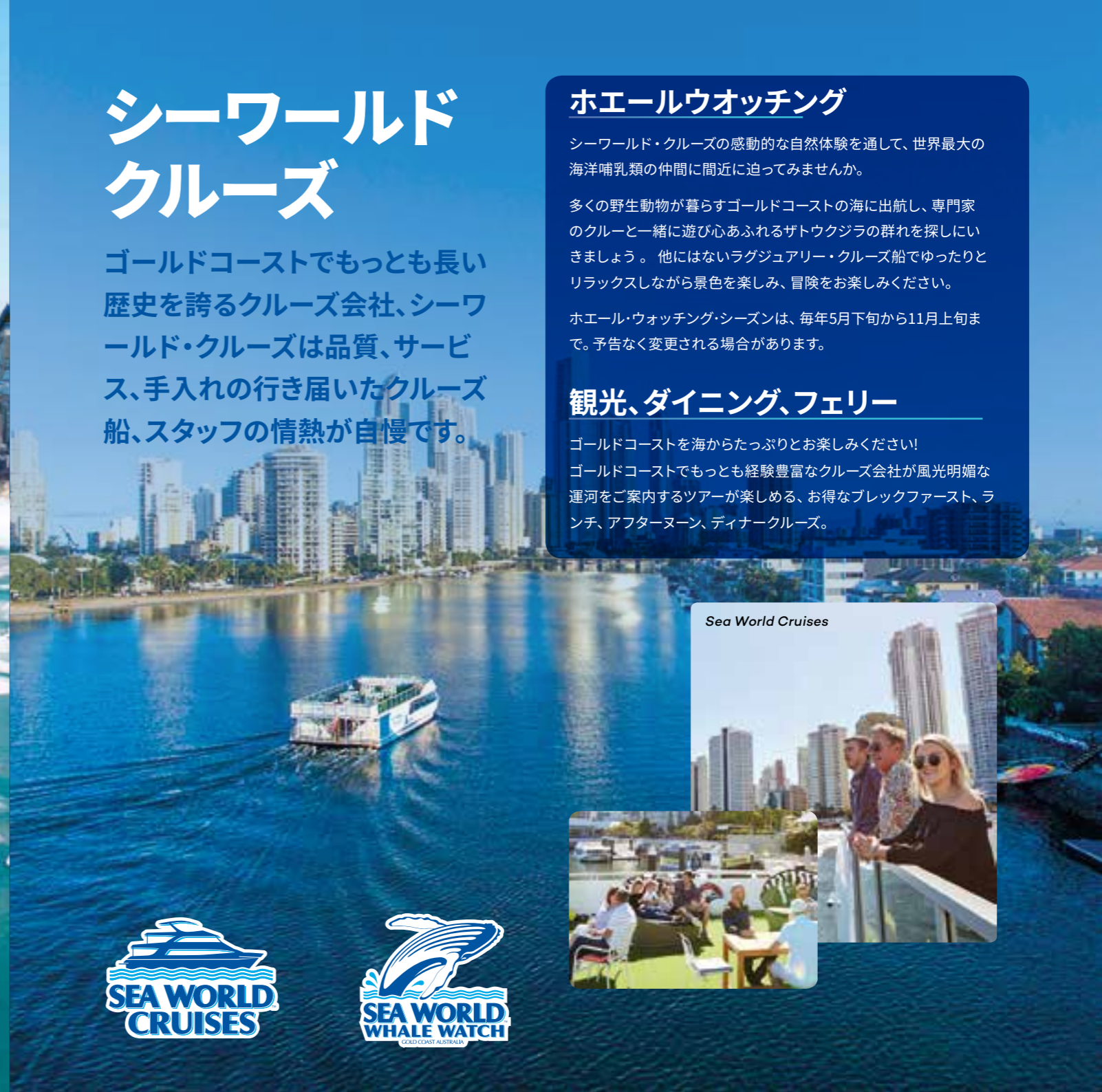
Sea World Cruises

ゴールドコーストでもっとも経験豊富なクルーズ会社が風光明媚な 運河をご案内するツアーが楽しめる、お得なブレイクファースト、ラ ンチ、アフタヌーン、ディナークルーズ。