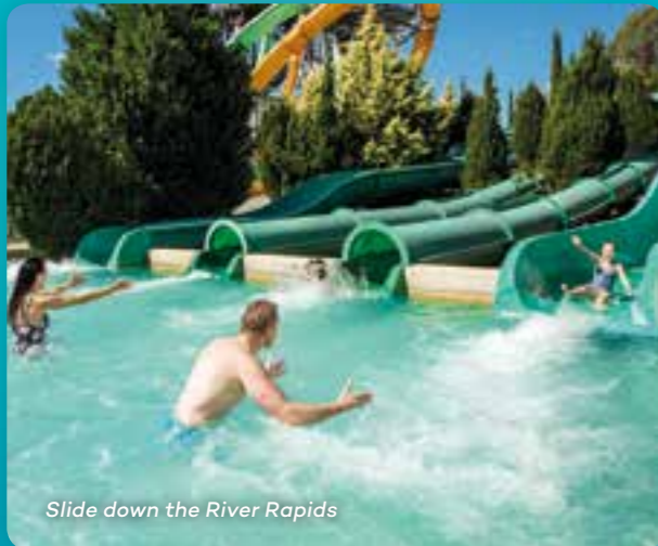
Slide down the River Rapids