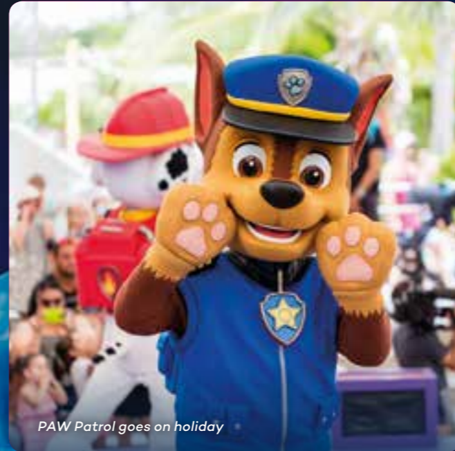
PAW Patrol goes on holiday

해외 학생들은 호주 씨월드에서 해양동물들의 놀라운 세계를 발견할 수 있습니다. 프로그램을 찾는 모든 학생들에게 절대로 놓치고 싶지 않은 흥미진진한 교육 체험이 될 것입니다.