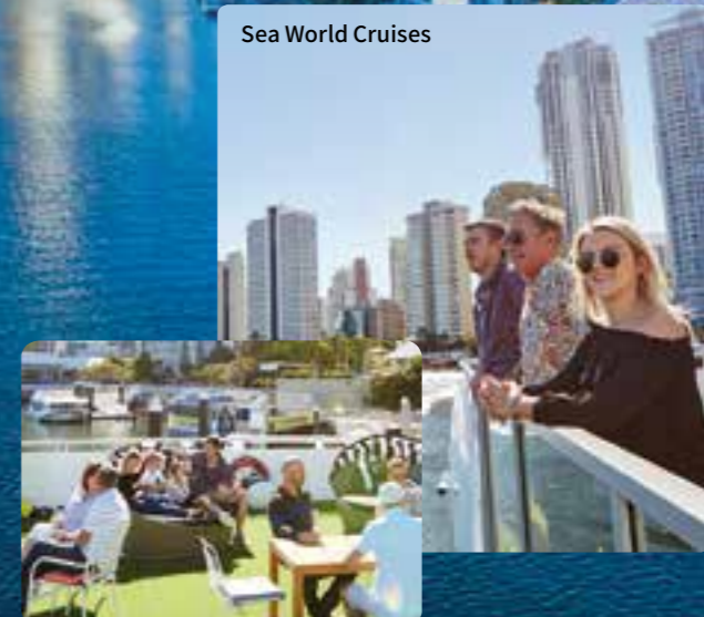
Sea World Cruises

골드코스트의 최고 구경은 물에서 하는 체험입니다! 저렴한 아침, 점심, 오후, 저녁 크루즈로 아름다운 물길을 안내해 드리는 골드코스트 최대 경험의 크루즈 회사에게 골드코스트 관광을 맡겨 주십시오.