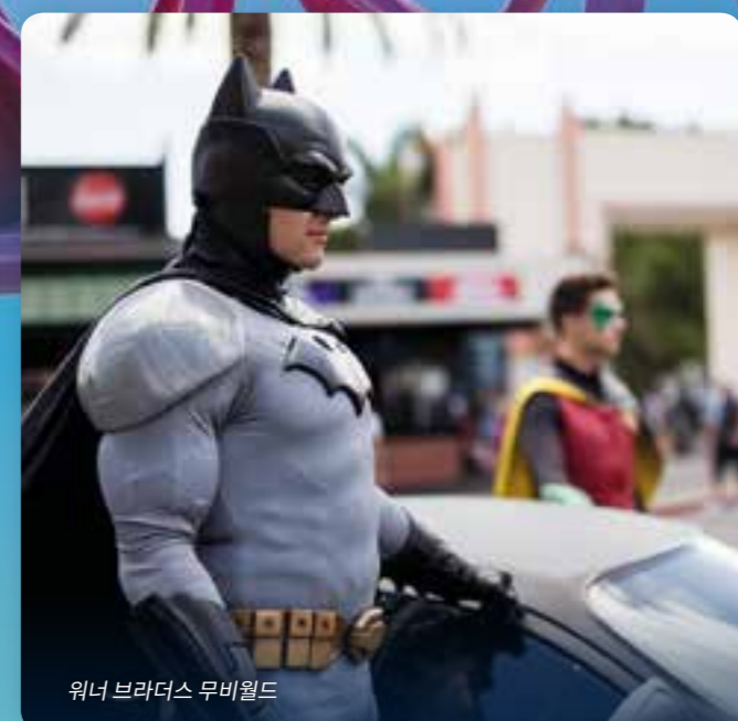
워너 브라더스 무비월드