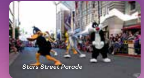
Stars Street Parade