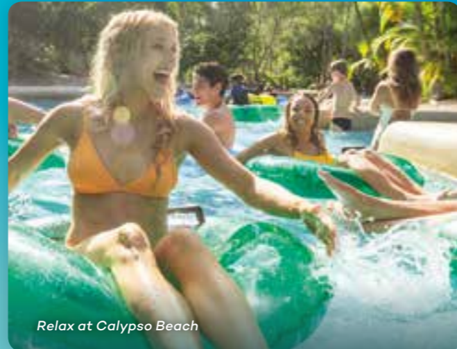
Relax at Calypso Beach