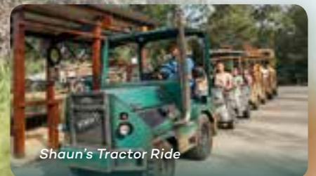
Shaun's Tractor Ride