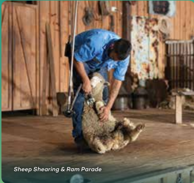
Sheep Shearing & Ram Parade