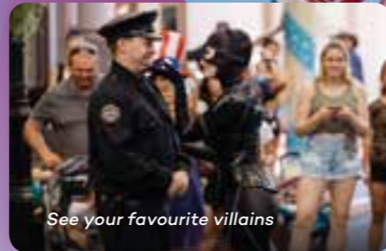
See your favourite villains