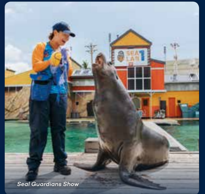
Seal Guardians Show