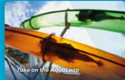
Take on the AquaLoop