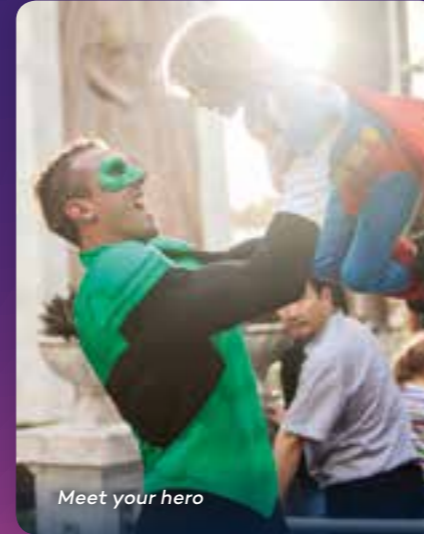
Meet your hero

해외 학생들은 워너 브라더스 무비월드에서 영화의 마법이 되살아나는 것을 체험할 수 있습니다. 프로그램을 찾는 모든 학생들에게 절대 놓치고 싶지 않은 흥미진진한 교육 체험이 될 것입니다.