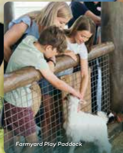
Farmyard Play Paddock