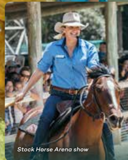
Stock Horse Arena show