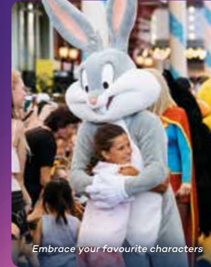
Embrace your favourite characters