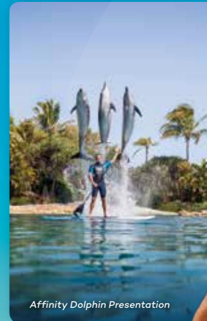
Affinity Dolphin Presentation