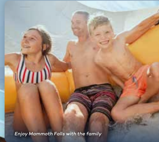
Enjoy Mammoth Falls with the family