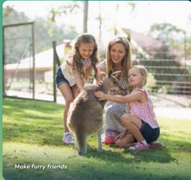
Make furry friends