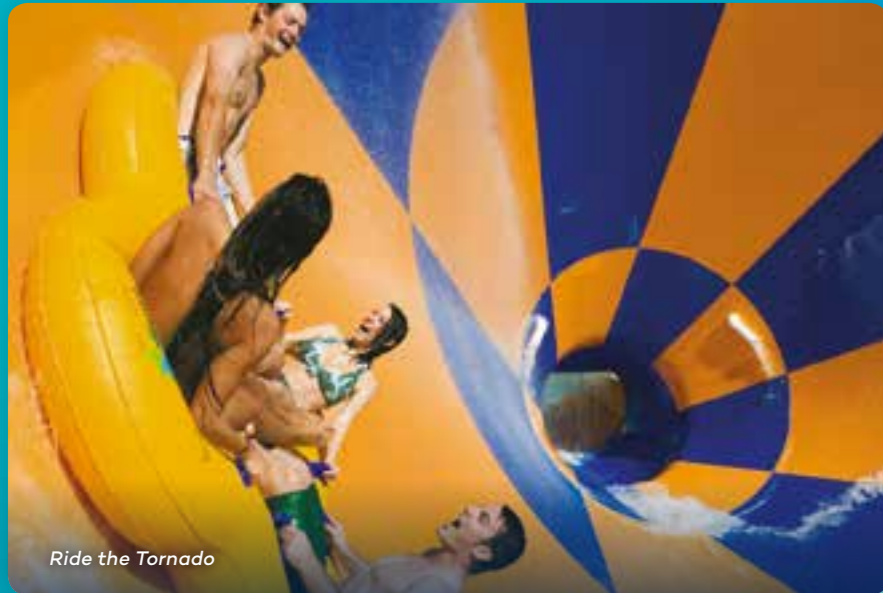
Ride the Tornado