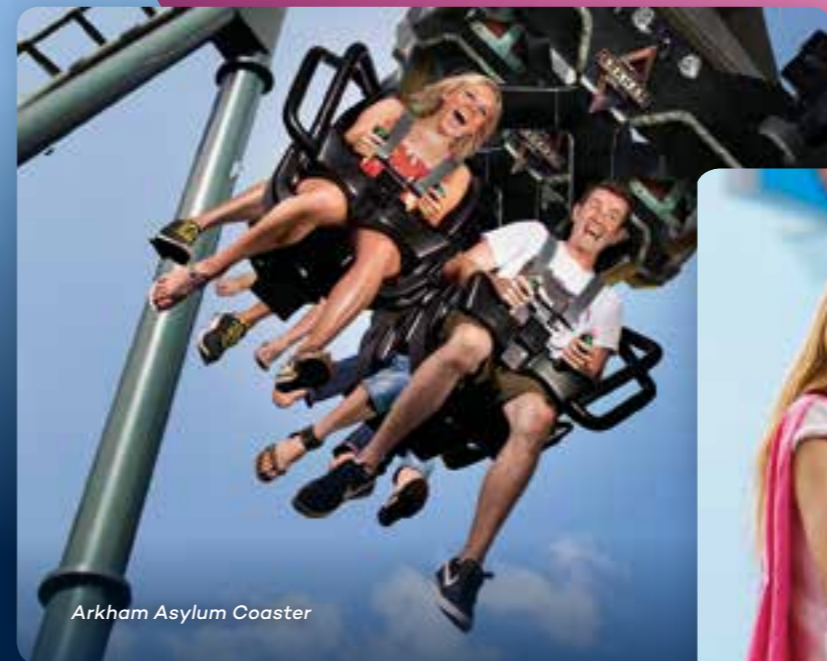
Arkham Asylum Coaster