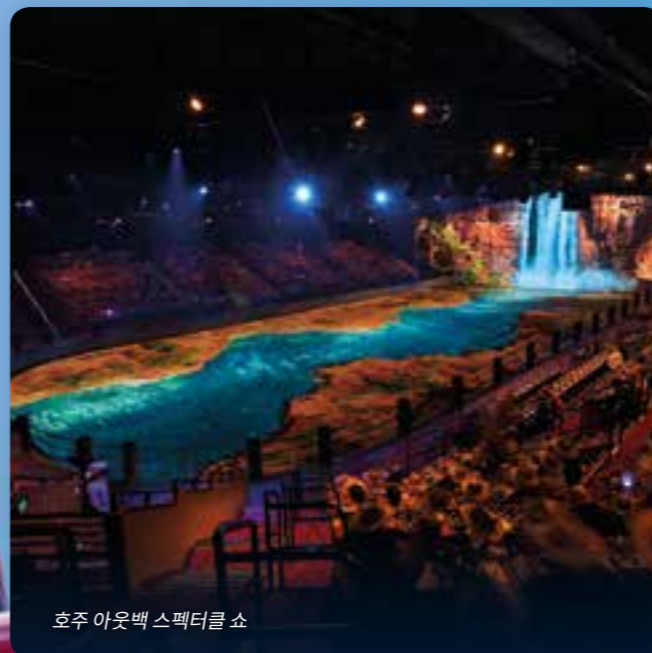
호주 아웃백 스펙터클 쇼