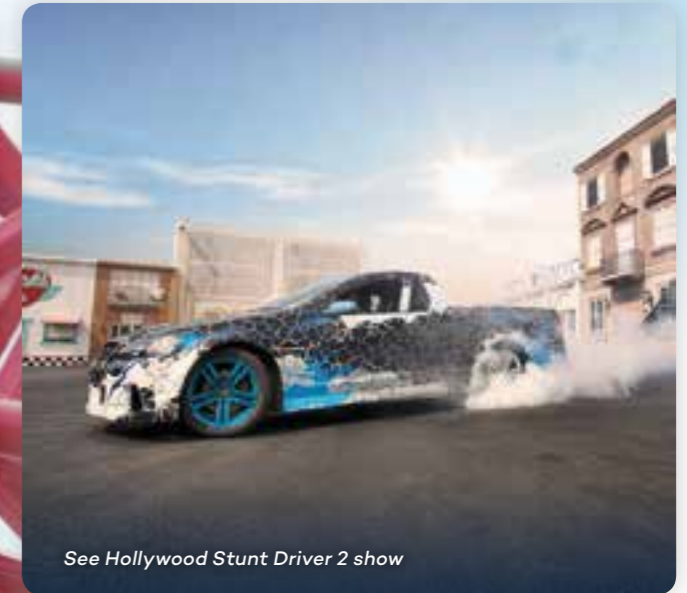
See Hollywood Stunt Driver 2 show