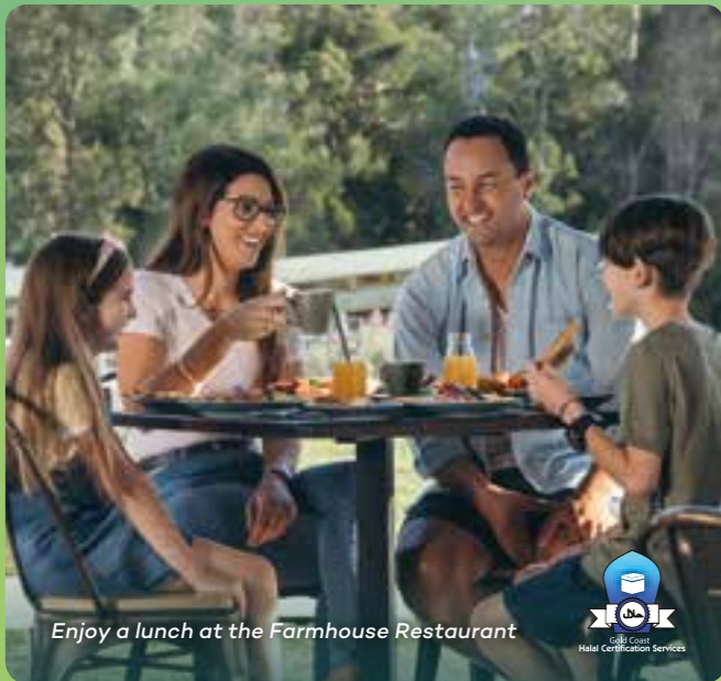
Enjoy a lunch at the Farmhouse Restaurant