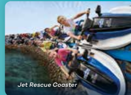
Jet Rescue Coaster