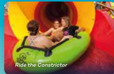
Ride the Constrictor