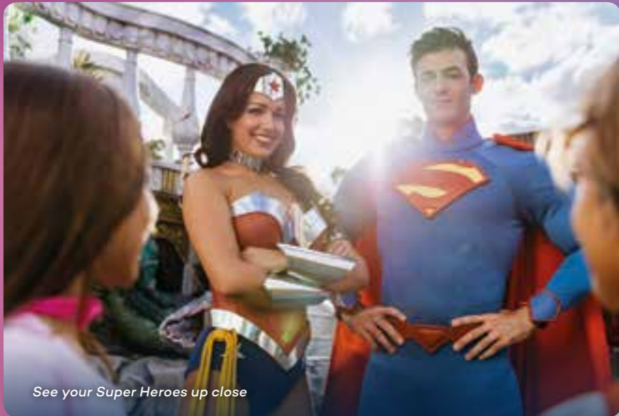
See your Super Heroes up close