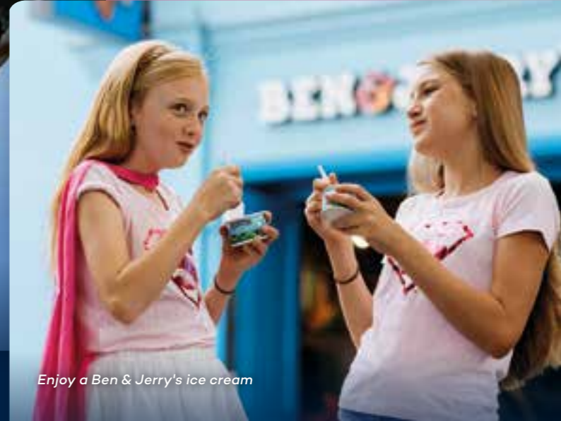
Enjoy a Ben & Jerry's ice cream