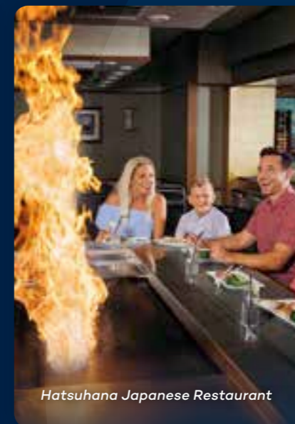
Hatsuhana Japanese Restaurant