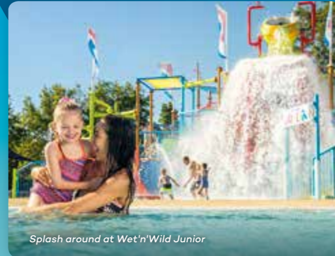
Splash around at Wet'n'Wild Junior