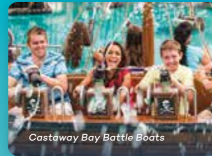
Castaway Bay Battle Boats