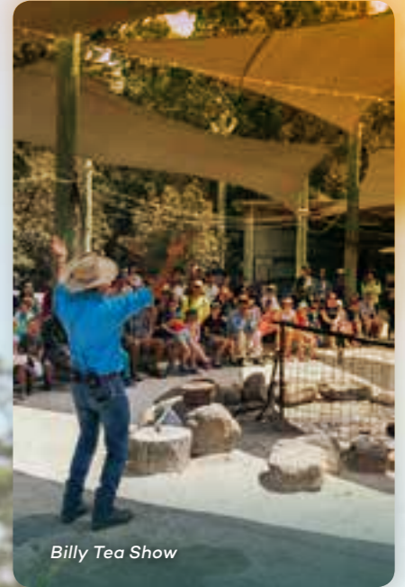
Billy Tea Show