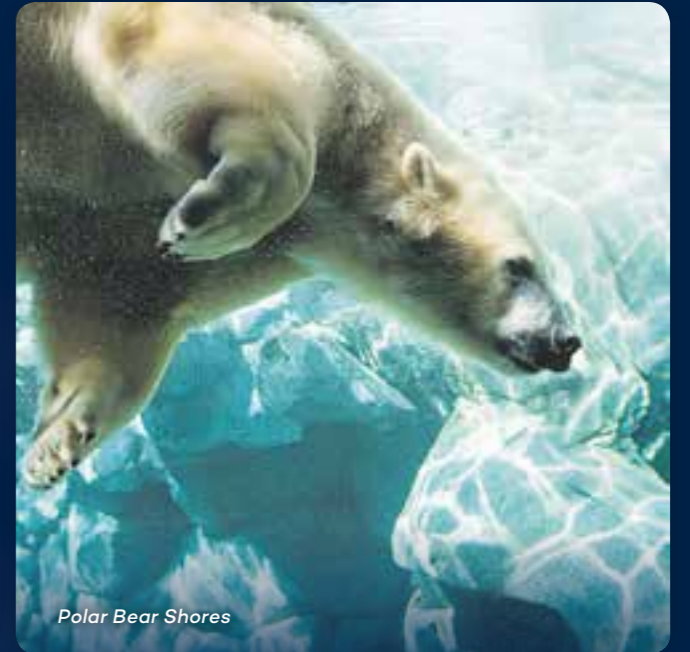
Polar Bear Shores