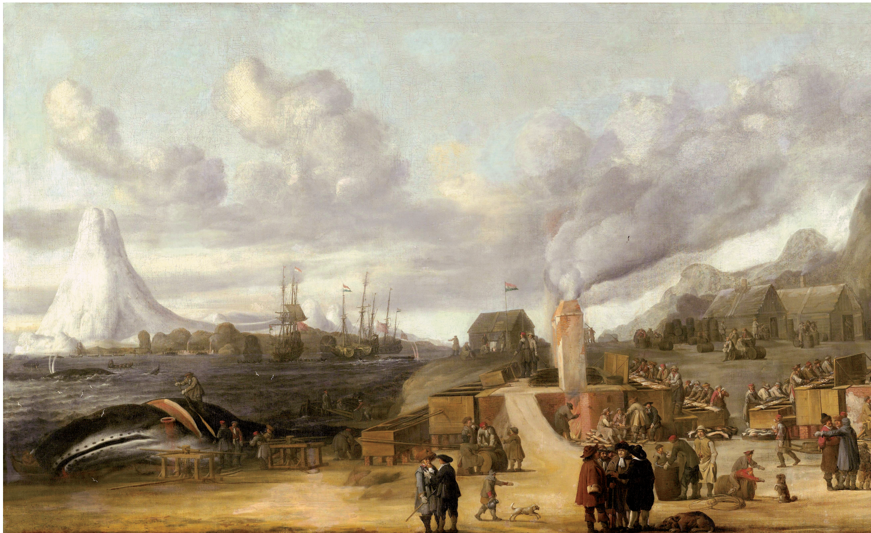
Fig. 1 Cornelis de Man. Een Nederlands walvisvangststation in de Noordelijke IJszee. ca. 1639. Rijksmuseum, Amsterdam.