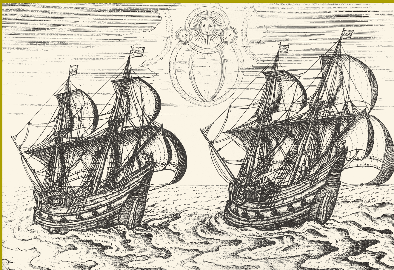
Fig. 4 De twee schepen van de derde expeditie van Willem Barentsz die op 4 juni 1596 een wonderlijk hemelteken zagen afkomstig uit het dagboek van Gerrit de Veer (1598).