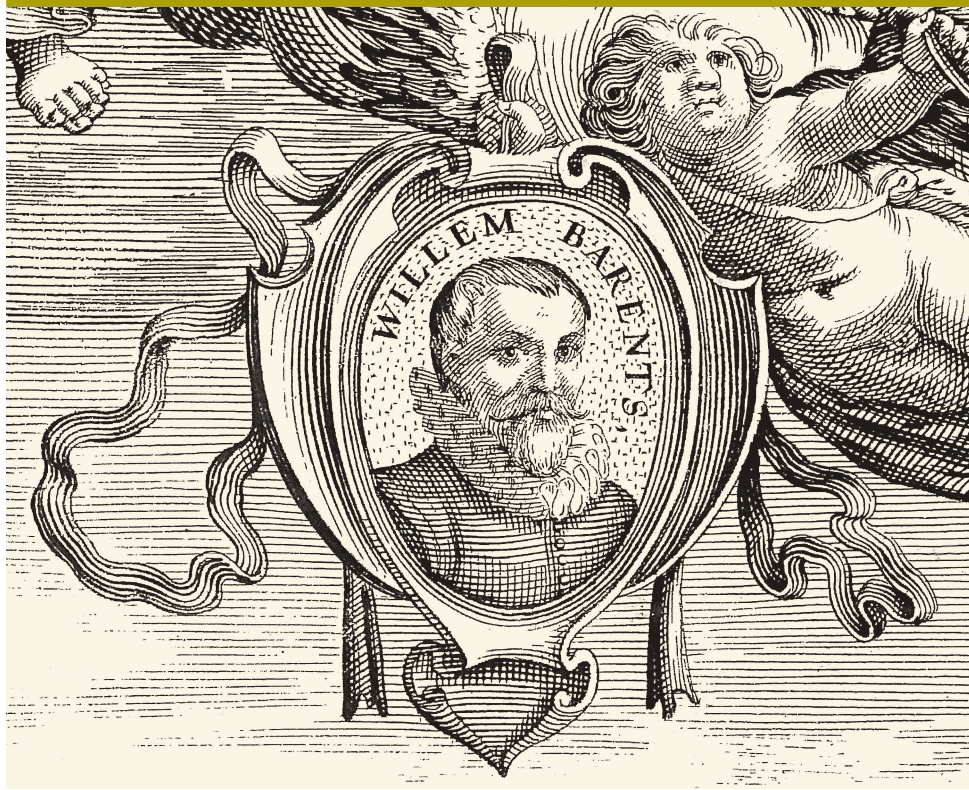
Fig. 3 Portret van Willem Barentsz afkomstig uit het stadsprofiel van Amsterdam van Abraham Koninck 1613.