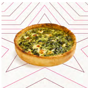
Quiche di spinaci e formaggio di capra