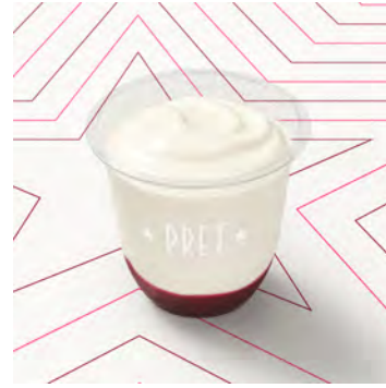
Yogurt zero grassi e frutti rossi