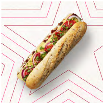
Baguette cheddar stagionato e chutney di cipolle V.