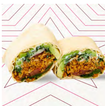
Pita avocado e falafel V.