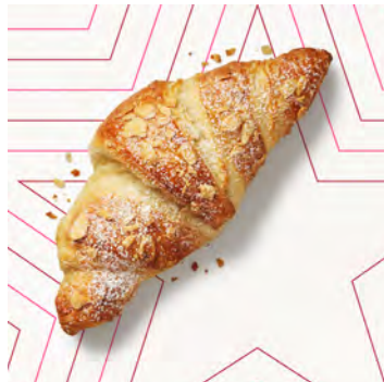
Croissant alle mandorle