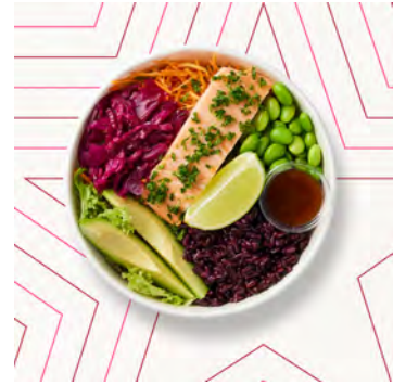
Bowl con salmone arrosto, riso nero e prezzemolo