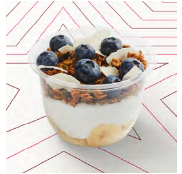
Yogurt cocco e mirtilli