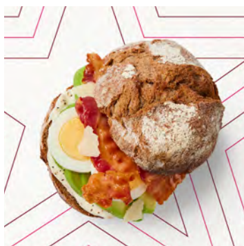
Pane tondo avocado, uovo, bacon