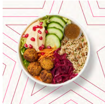
Bowl di falafel meze e quinoa