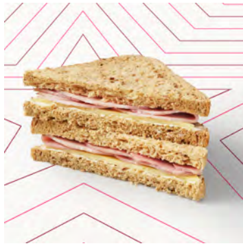
Prosciutto e cheddar