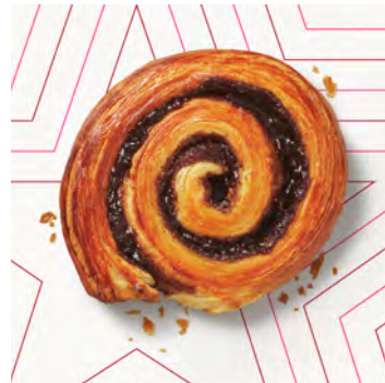
Rotolo alla cannella