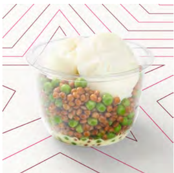
Lenticchie e uova in camicia