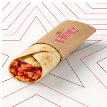
Wrap caldo pollo e peperoncino