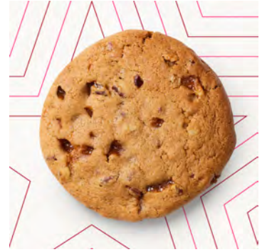
Biscotto al caramello e noci Pecan