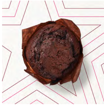
Muffin al cioccolato