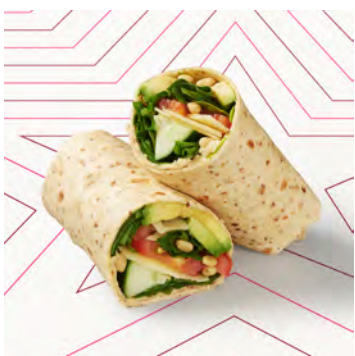
Wrap avocado e pinoli V.