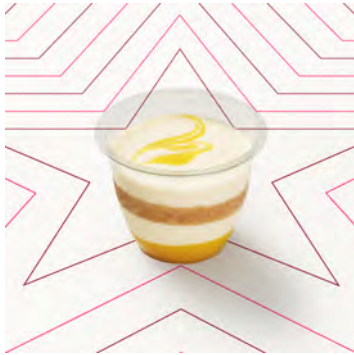
Cheesecake al limone