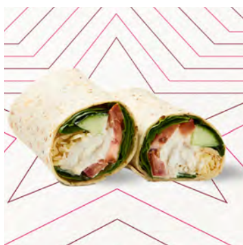
Wrap Pollo e salsa Caesar