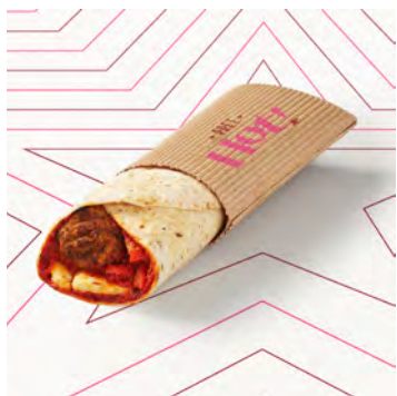
Wrap caldo falafel, cheddar e peperoni