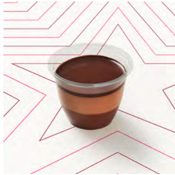
Mousse al cioccolato