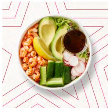
Insalata avocado e gamberi