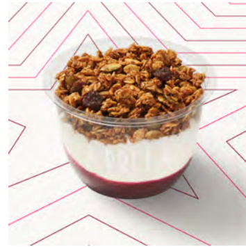
Yogurt zero grassi frutti rossi e granola