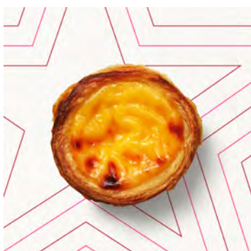
Pastel de Nata