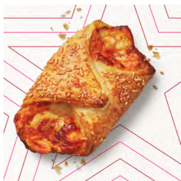
Croissant prosciutto e formaggio