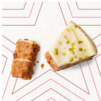
Torta di carote