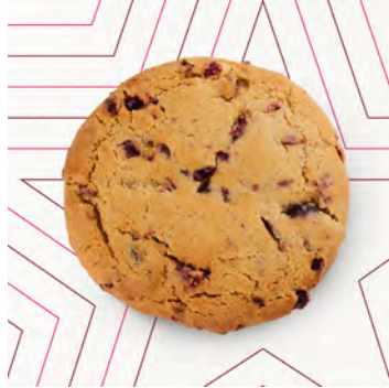
Biscotto al mirtillo rosso