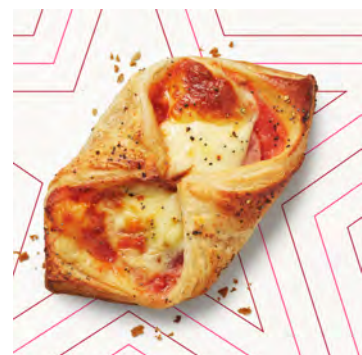
Croissant mozzarella e pomodoro