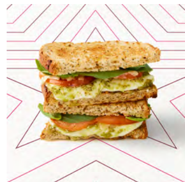
Toastie - Mozzarella e pesto