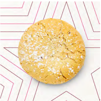
Biscotto farcito al cioccolato e nocciole