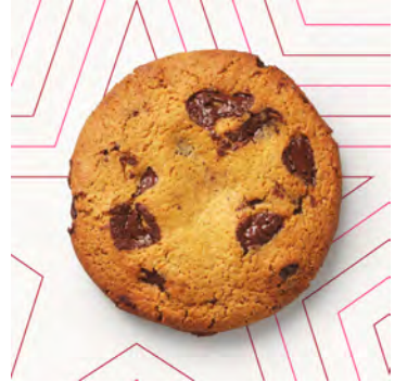
Biscotto con pezzi di cioccolato