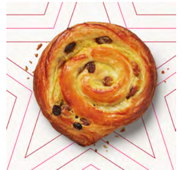
Pane con uvetta