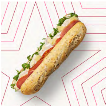
Baguette pollo e bacon