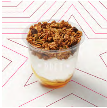
Yogurt zero grassi granola e miele