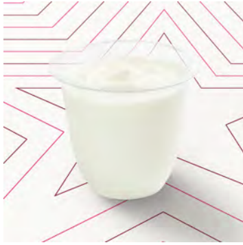
Formaggio bianco 0%