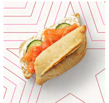
Losange salmone affumicato e Formaggio spalmabile