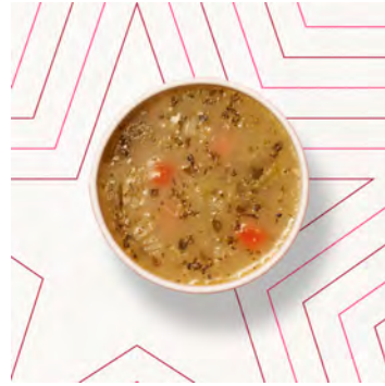
Zuppa Pollo e broccoli