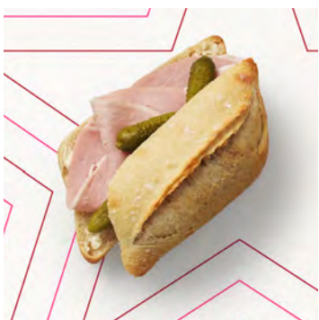
Losange prosciutto e cheddar