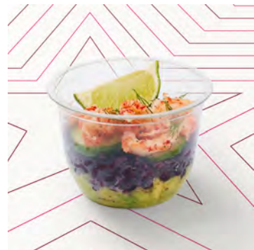
Avocado, riso nero e gamberi