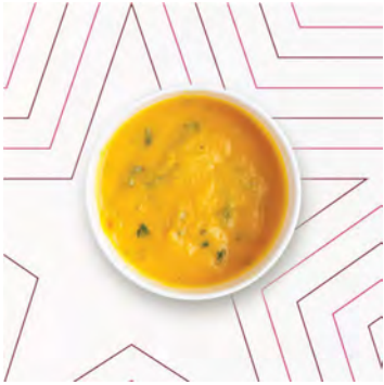
Zuppa Carote e Coriandolo