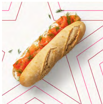
Baguette salmone, Formaggio spalmabile e aneto