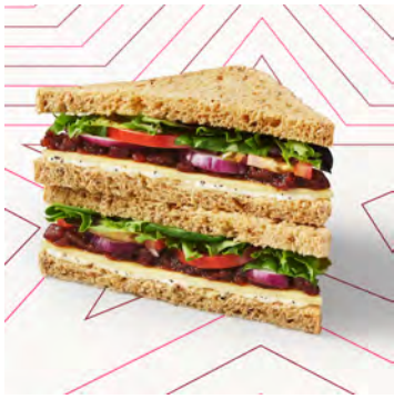
Cheddar Chutney Pret V.