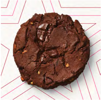
Biscotto al cioccolato fondente e mandorle