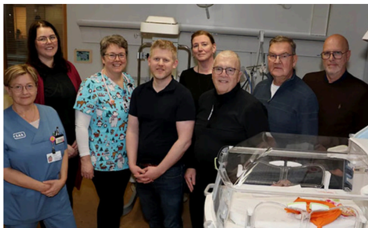
Frá afhendingu hitakassa á barnadeild

Öndunarmælingatæki til betri greininga Hollvinir gáfu einnig öndunarmælingatæki á rannsóknastofu lífeðlisfræðideildar sem bætir greiningu og meðferð sjúklinga með öndunarvandamál. Nýja tækið (Vintus One) gefur möguleika á mismunandi tegundum öndunarmælinga, s.s. fráblástursmælingu, loftdreifiprófi, mælingu á rúmmáli lungna og sveiflumælingu. Sjúkrahúsið á Akureyri þakkar Hollvinum innilega fyrir þeirra mikilvæga framlag og veittan stuðning. Þessar gjafir endurspeglu einstakan samfélagslegan samtakamátt samtakanna.