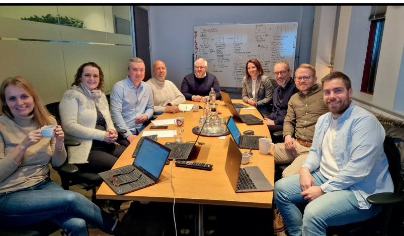
Frá fyrsta vinnufundi NTÍ og Advania með Island.is