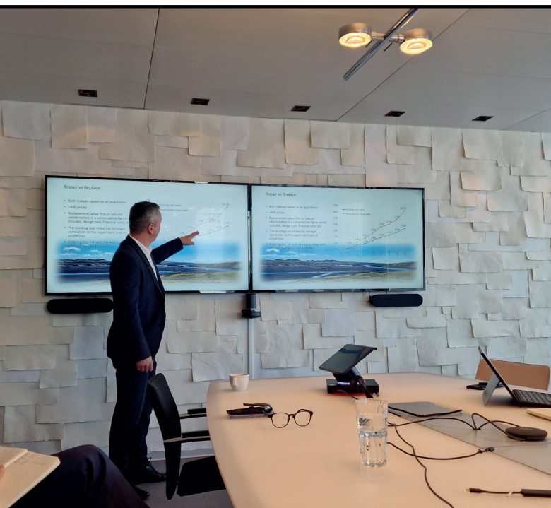
Svipmynd af endurtryggingaráðstefnu í Kaupmannahöfn í október 2022