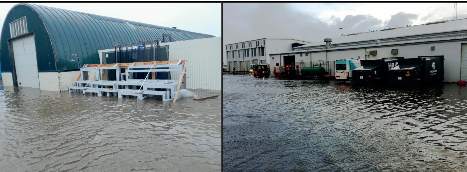
Myndir úr sjávarflóði í Grindavík 6. janúar 2022

Tilkynnt tjónamál voru samtals 139 og af þeim leiddu 68 til greiðslu tjónabóta, í 12 málum var um að ræða minniháttar tjón, þar sem bótafjárhæð var lægri en eigin áhætta og í 59 málum var ekki unnt að rekja skemmdir til þeirra náttúruhamfara sem stofnunin váttryggir gegn.