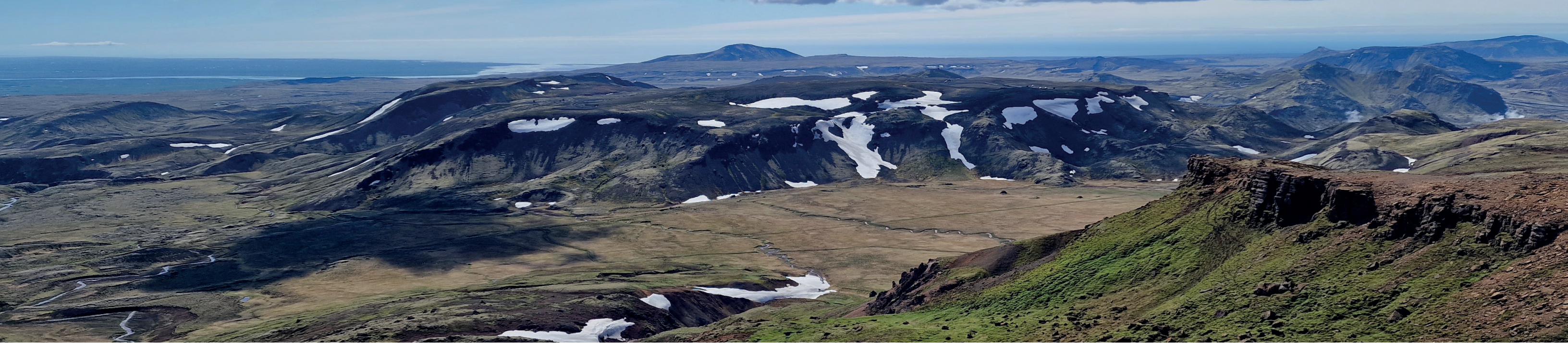
Útsýni að Ölfusá til suðausturs af Henglinum