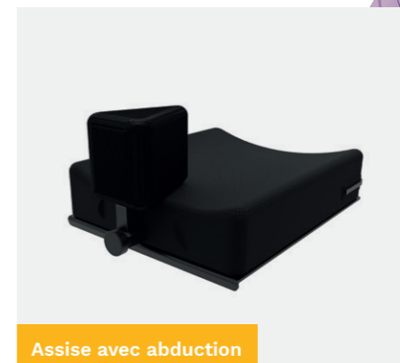
Assise avec abduction