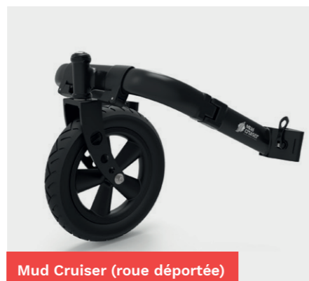
Mud Cruiser (roue déportée)