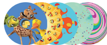
Large gamme de flasques