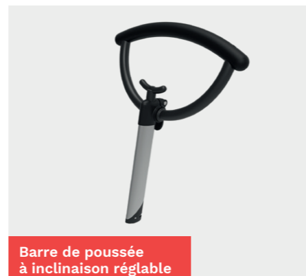
Barre de poussée à inclinaison réglable