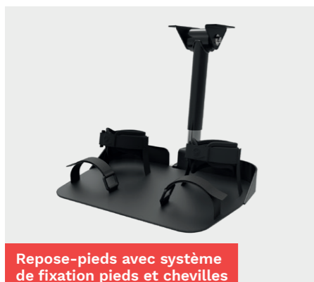
Repose-pieds avec système de fixation pieds et chevilles