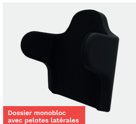
Dossier monobloc avec pelotes latérales