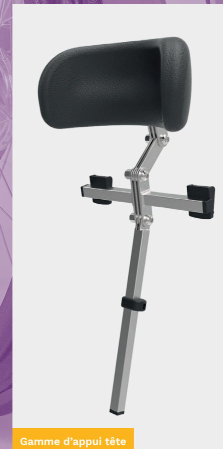
Gamme d'appui tête