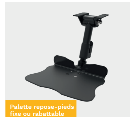
Palette repose-pieds fixe ou rabattable