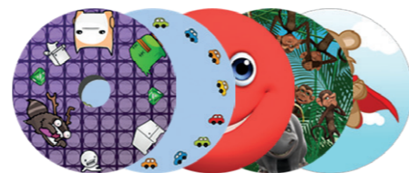
Large gamme de flasques

Une personnalisation complète du fauteuil