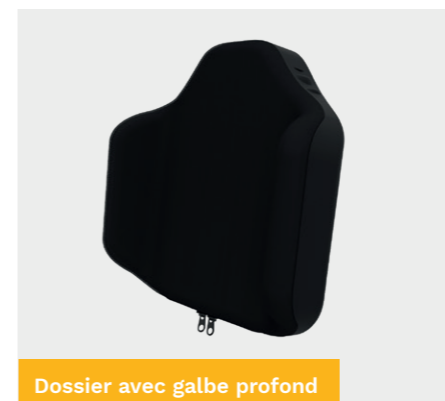
Dossier avec galbe profond