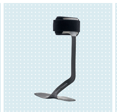
WalkOn Trimable 28U23