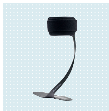
WalkOn Flex 28U22