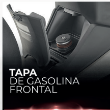
TAPA DE GASOLINA FRONTAL