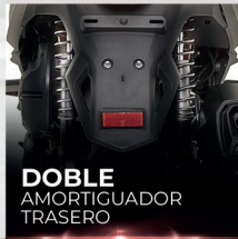
DOBLE AMORTIGUADOR TRASERO