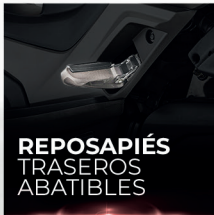
REPOSAPIÉS TRASEROS ABATIBLES