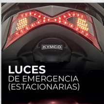
LUCES DE EMERGENCIA (ESTACIONARIAS)