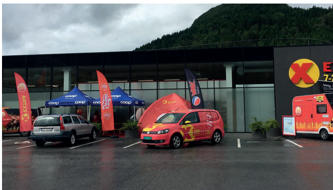
Extra Naustdal: Extra Road-show sommaren 2017.