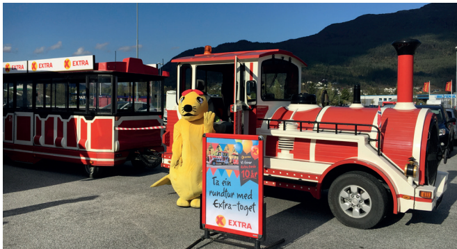
Extra Førde: Extra Førde var 10 år i oktober 2017.