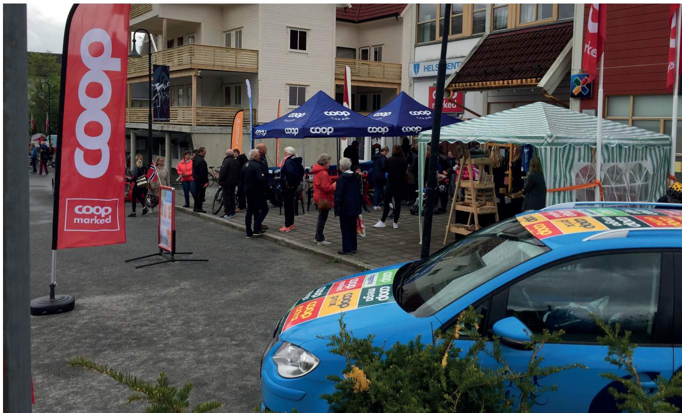
Coop Marked Balestrand