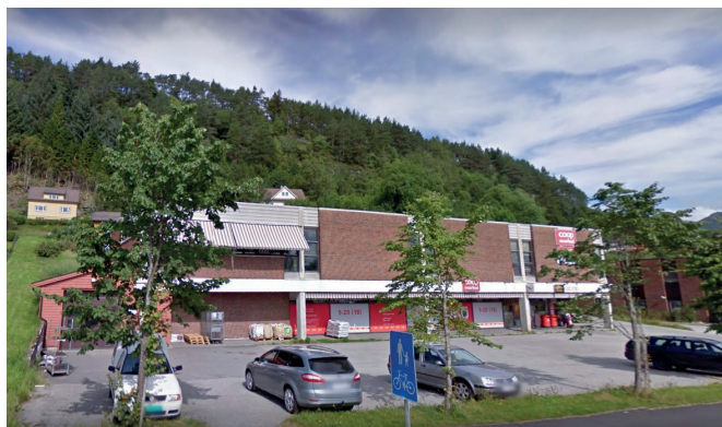
Coop Marked Askvoll