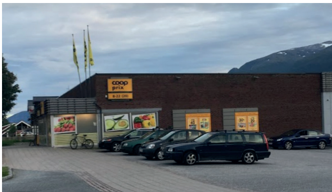
Coop Prix Hermansverk