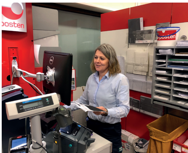
Mega Førde: Førde Post i Butikk.