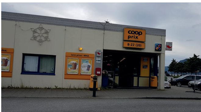
Coop Prix Selje