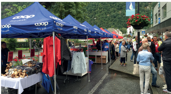
Extra Høyanger: Marknadsdag i 2017.