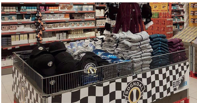
Extra Sogndal: Sogndalsbua opna på Extra Sogndal. Coop Vest er sponsor til Sogndal fotball. Som ein del av samarbeidet sel Extra Sogndal sogndalseffekter.