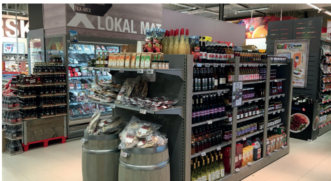
Lokalmat: Coop Vest satser på lokalmat. Her frå Extra Dale som opna 16. november 2017.