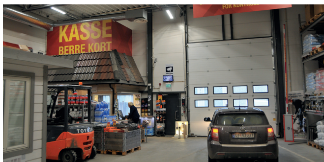
Ved utgangen vert varene skanna og du kan betale.