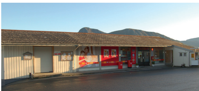
Coop Marked Kvamøy