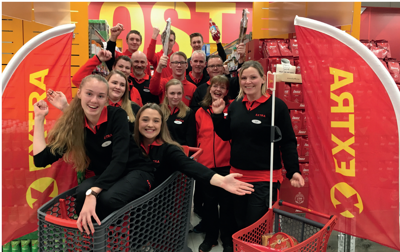
Extra Dale opna 16. november 2017 Flott bukett tilsette ønskte kundane velkommen med.