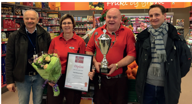
Coop Marked Syvde: Coop Vest sin butikk i bygda er spesielt god på frukt og grønt, og kan sjå tilbake på mange utmerkelser.