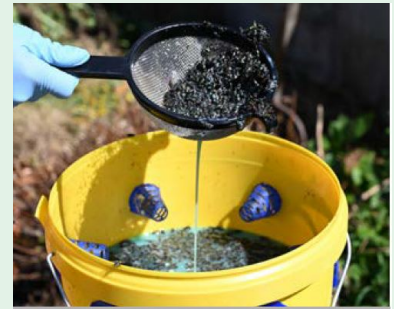
Le piège à mouches FlyBuster est particulièrement efficace