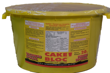
CAKE BLOC Ferien Spezial

Deshalb macht der CAKE BLOC Ferien Spezial sowohl für die trächtige Kuh, wie auch für das Kalb Sinn. ■