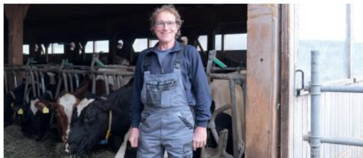
«Dank UHS kann ich standortgerecht Milch produzieren.»

bei der Fruchtbarkeit greifen. Nebst den monatlichen Auswertungen erhalten die UHS-Betriebe eine Jahresauswertung, welche sowohl die Entwicklung des Betriebs aufzeigt, wie auch den Vergleich mit Berufskollegen und Berufskolleginnen erlaubt.