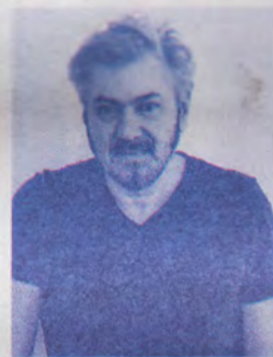
VINCENZO DE COTIIS Tessuti, marmi, legni e metalli pregiati i protagonisti dell'appartamento a Shenzhen, Cina. La cifra dell'architetto milanese si distingue per l'eleganza minimale riscaldata dai preziosismi delle lavorazioni craft. ▣ decotiis.it