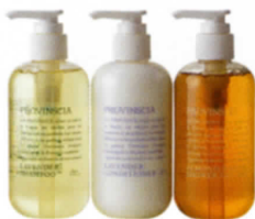
064 HOTEL ANTEROOM KYOTO

ハガキ 奈良のシンボルでもある鹿をモチーフに型押しをした、シンプルなハガキ。秋篠の森のショップ(月草)にて販売されている。10枚入り600円。