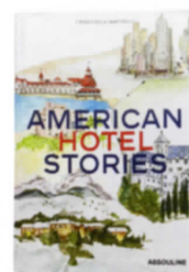
012 パラマウント ホテル

ネームタグ 各リゾートでチェックアウト時に、名前を入れてスーツケースに付けてくれるサービスを実施。ホテルごとにデザインが異なりコレクターも多い。