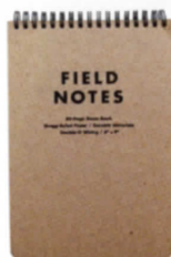
012 パラマウント ホテル

靴用ブラシ 木製の持ち手に、イノシシの天然毛。NYのブランド(Izola)発、1950年風レトロなシューブラシはギフトにも、また部屋に飾っても。29ドル。