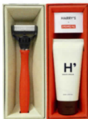
046 スタンダード・ハイライン

シャンプー、トリートメント、ボディジェル 南仏の植物エキスやオイルを配合したペリカン石鹸によるプロバンシアのバス用品。香りの高さが特徴。各973円。