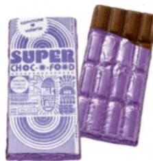
046 スタンダード・ハイライン

A6のメモ帳 リトル・ノート・ジャイアント・アイデアズ。さすがにクジラはいないが動物園の隣なので動物モノが多数。旅のメモにぴったり。5ユーロ。