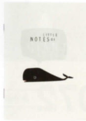
062 25アワーズ ホテル ビキニ ベルリン

シェービングキット 若者2人が始めたカミソリブランド(Harry's)とスタンダードとのコラボ商品。1本1本、ドイツの工場で作人が作り上げる。15ドル。