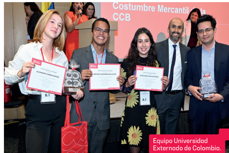
Equipo Universidad Externado de Colombia.