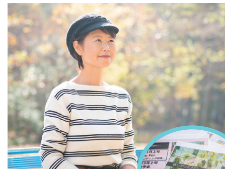
帽子ブランドのプレゼン資料準備は着々とすすんでいる

やがて、「多様な働き方実践企業」として注目を浴びるようになり、県の「女性活躍の好事例集」に紹介され、「女性活躍を推進する企業」