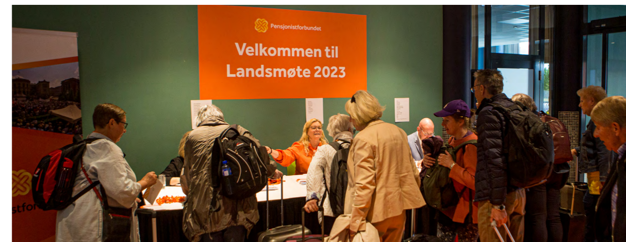
Alle landsmøtedeltakerne måtte registrere seg ved ankomst, og køen gikk fort unna.

Etter åpningstalen ble innkalling, forretningsorden og fullmakter enstemmig