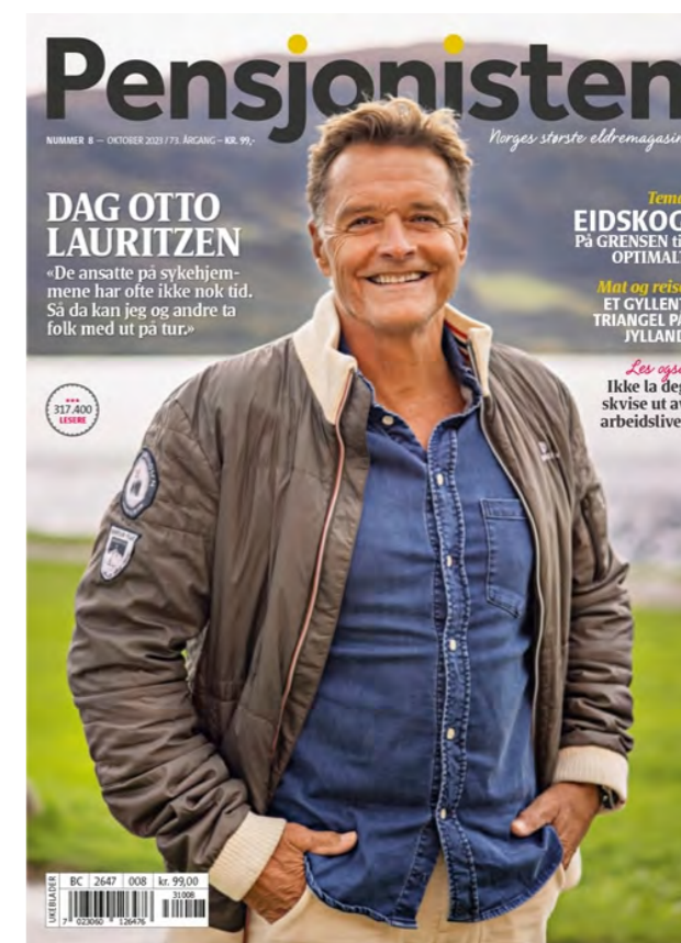
Forsiden til Pensjonisten nr. 8 2023 – utgitt i oktober.

Slik presenteres Pensjonisten på Pensjonistforbundets hjemmeside. Her kan medlemmer lese alle utgaver av medlemsmagasinet helt tilbake til 2016.