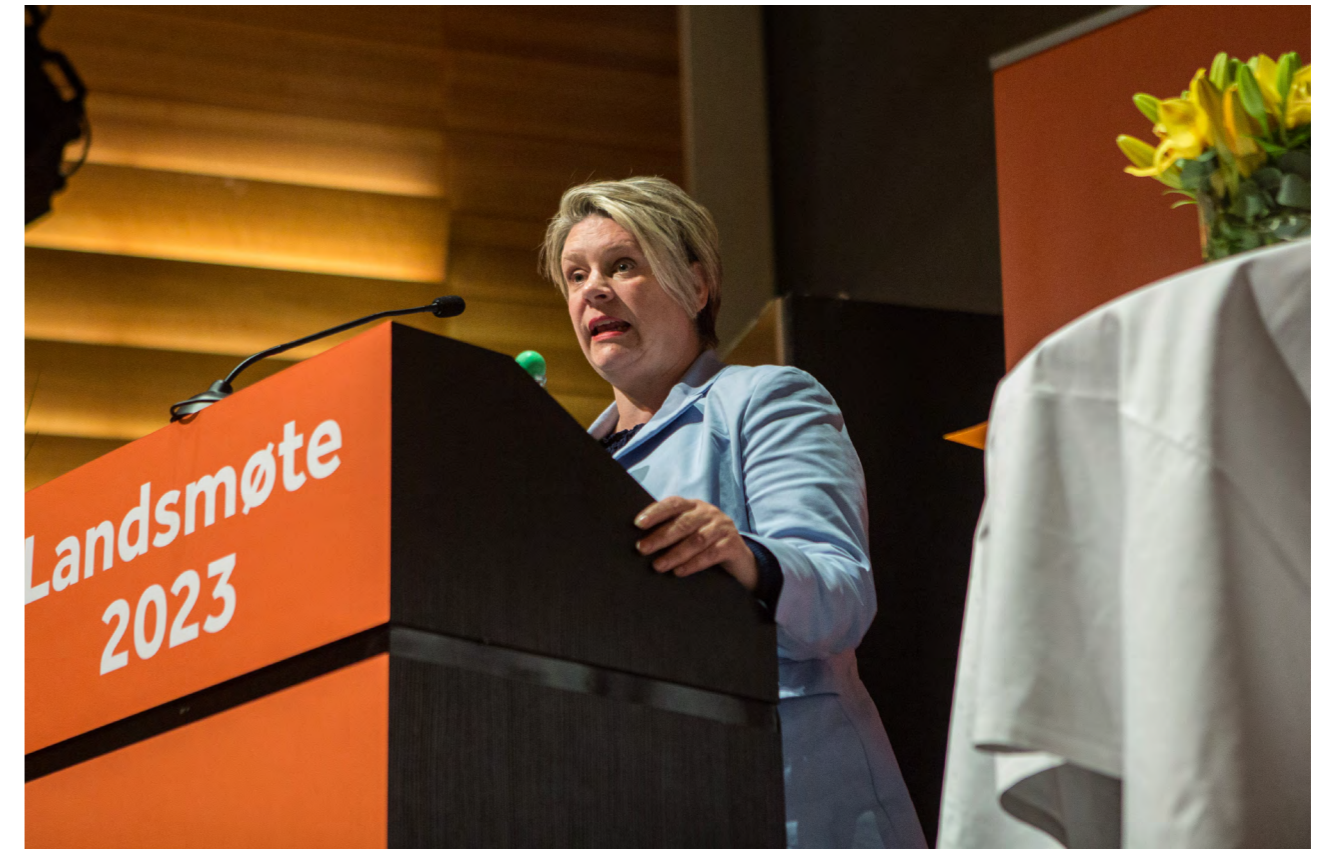
Arbeids- og inkluderingsminister Marte Mjøs Persen (Ap) holdt innlegg og svarte på spørsmål.

Pensjonistforbundet markedsførte «Sterk og stødig»- treningsgrupper og samarbeidet med frivillige instruktører om informasjon og tilbud om trening i landsmøtepausene. Vi tilbød også