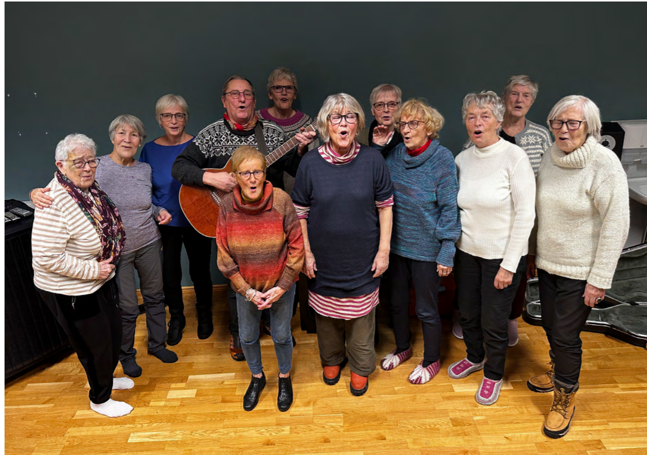
Pensjonistforbundet fikk penger til prosjektet «Vi synger sammen – helse i hver strofe.». Her er det medlemmer av Kabelvåg pensjonistforening som synger av full hals.

Det har i løpet av året blitt laget et introduksjonsprogram for tillitsvalgte, som beskriver Pensjonistforbundets organisasjon på alle nivå. Programmet var i utgangspunktet tiltenkt nye tillitsvalgte, men inneholder mye informasjon som også vil være nyttig for mer erfarne tillitsvalgte. Kursgruppa har fått i oppdrag å gjennomføre introduksjonsprogrammet.