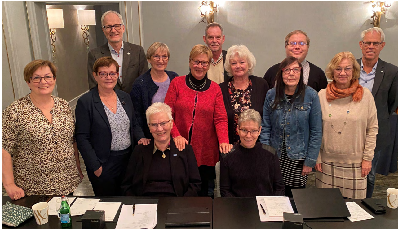
Pensjonistforbundet var vertskap for Nordiske Samarbeidskomiteens (NSKs) høstmøte i Oslo i oktober.

virksomhetsberetning og årsplan. Vertene for årsmøtet var Landssamband eldri borgara, LEB – Island. Det ble også tid til å besøke et energianlegg/strømproduksjon fra varme kilder.