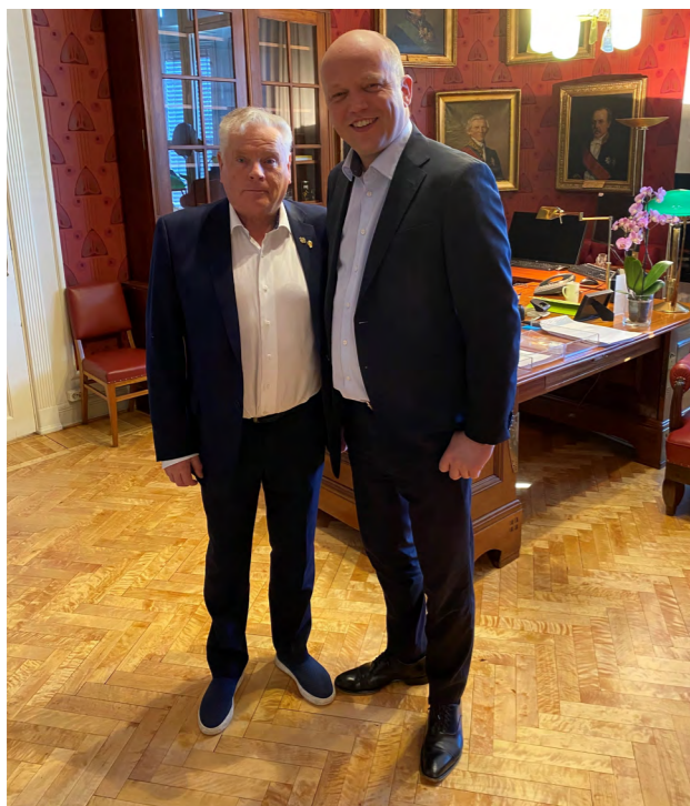
Forbundsleder Jan Davidsen møtte finansminister Trygve Slagsvold Vedum (Sp) og talte pensjonistenes sak.

Minstepensjon for enslige økte med 4 000 kroner fra 1. januar 2023, og ble videre oppregulert på linje med øvrig alderspensjon fra 1. mai. Inkludert den ekstraordinære økningen på 4 000 kroner ble årsveksten i minstepensjon for enslige 8,75 prosent i 2023.