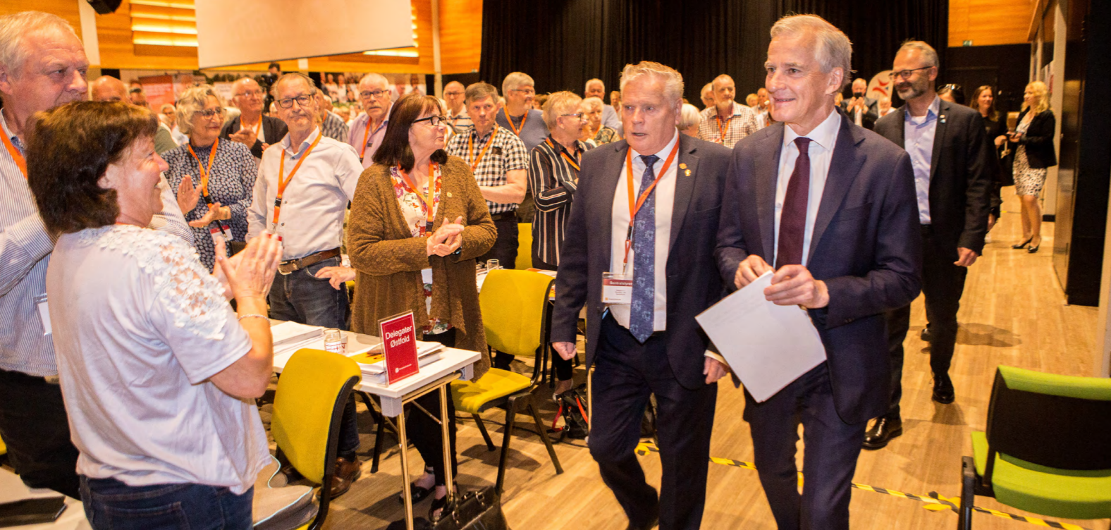
Det var knyttet stor spenning til hva statsminister Jonas Gahr Støre (Ap) hadde å si til landsmøtedelegatene.