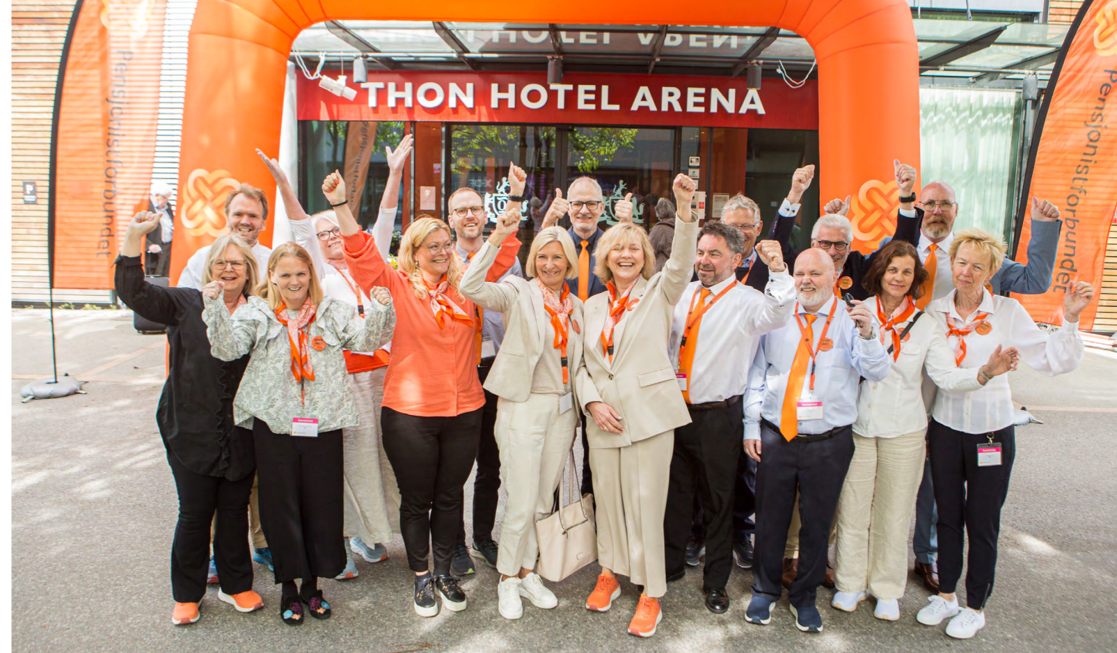
De ansatte i administrasjonen er klare til innsats!