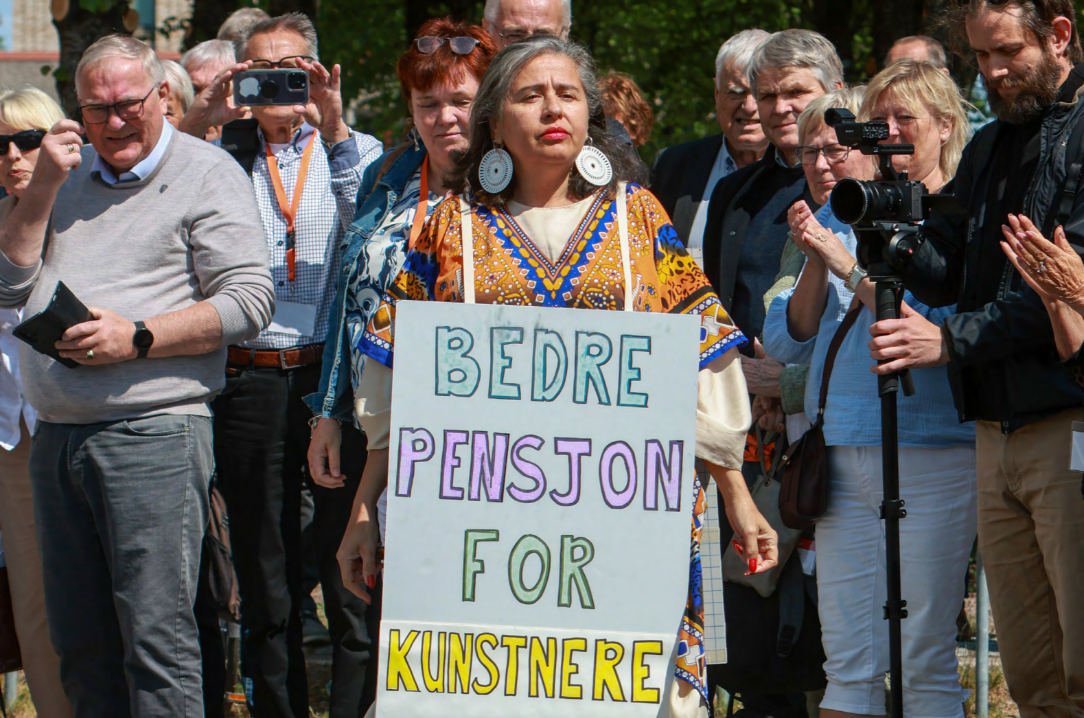
Her er kunstnergruppen First Supper Symposium (FSS) i gang med en markering for bedre pensjonskår for kunstnere, som avslutning på et vellykket landsmøte.