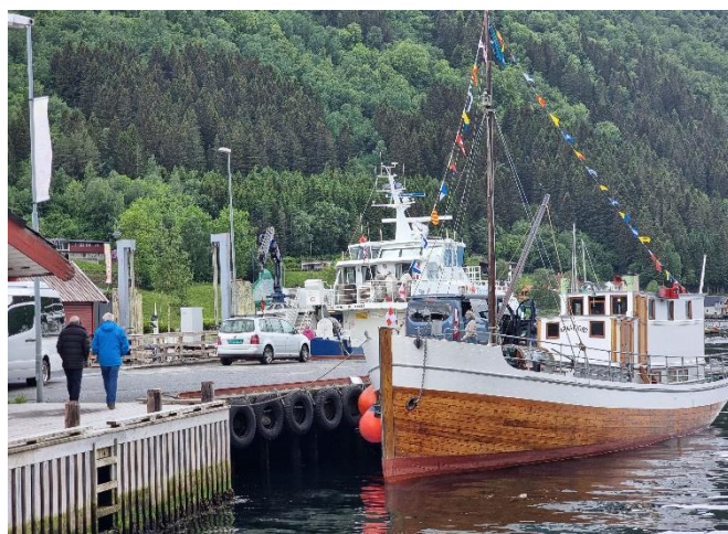
Havnemiljø med M/S Arnafjord bygd i Vik 1937