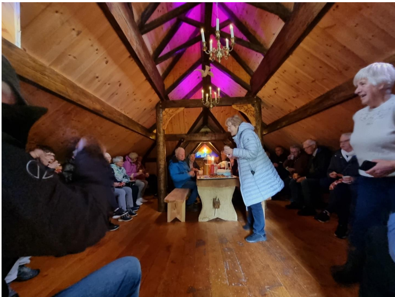
Matøkt i kyrkja