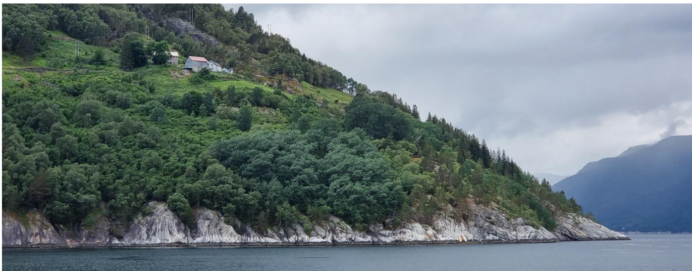
Alrek, fritt og høgt