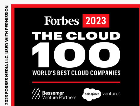
Lista Cloud 100 da Forbes