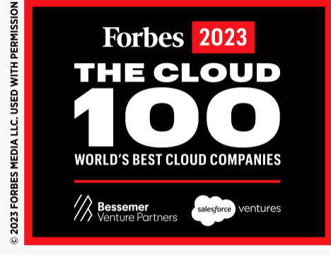
Forbes Cloud 100 listesi