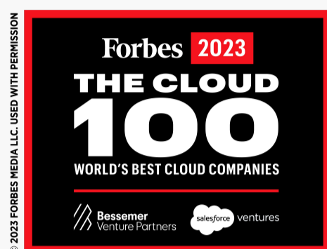
Lista Forbes Cloud 100