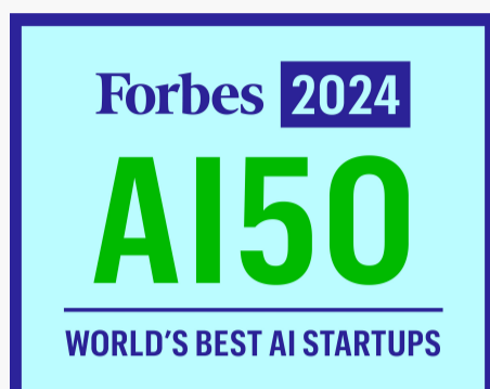
Lista AI 50 da Forbes