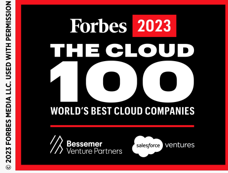
Forbes Cloud 100 listesi