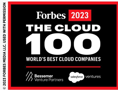
Lista Forbes Cloud 100