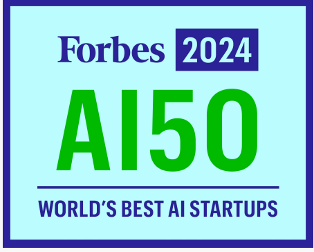
Forbes AI 50 listesi