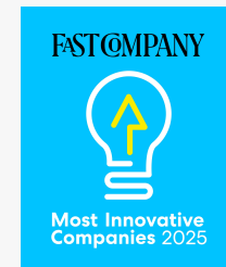
Fast Company: Most Innovative Companies 2025