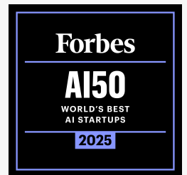
Forbes AI 50 2025