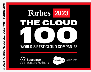
قائمة Forbes Cloud 100