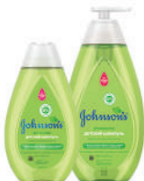
300, 500 мл Детский шампунь для волос с ромашкой