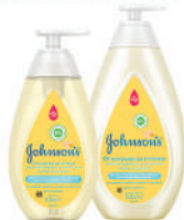
300, 500 мл Детский шампунь и пенка для мытья и купания «От макушки до пяточек»