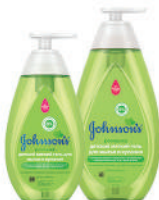
300, 500 мл Детский мягкий гель для мытья и купания