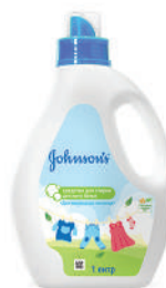
1 л Средство для стирки детского белья «Для маленьких непосед»