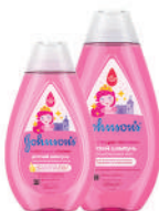
300, 500 мл Детский шампунь для волос «Блестящие локоны»