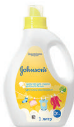
1 л Средство для стирки детского белья «Для самых маленьких»