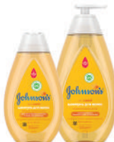
300, 500 мл Детский шампунь для волос