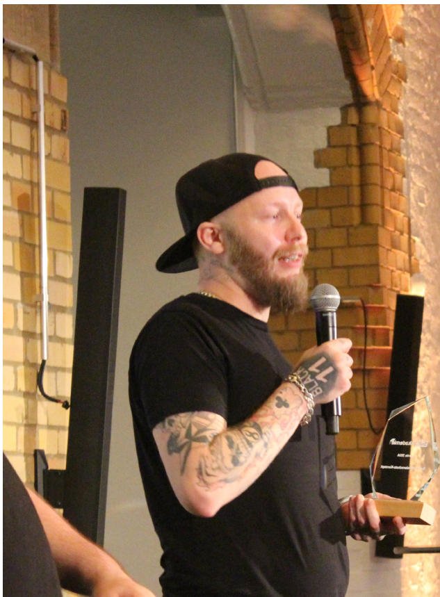
Dozent „Glaskugel“ hat mit dem besten Spielerschutzkonzept überzeugt