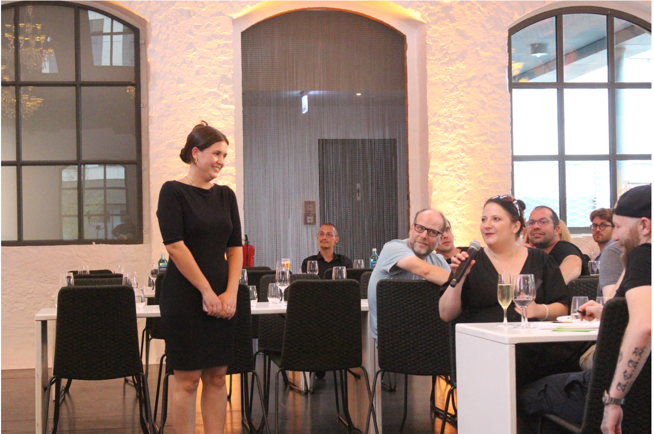
Dozenten, die die Fragen beantworteten, wurden zufällig gewählt.