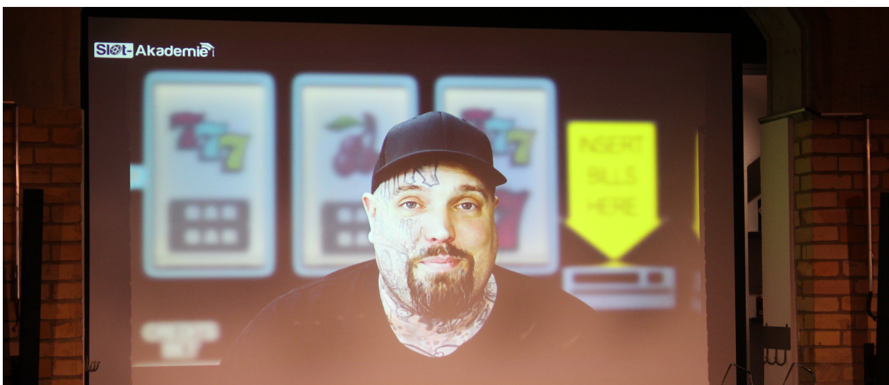
LoftyVTR wurde zum besten Dozenten der Slot Akademie gewählt.