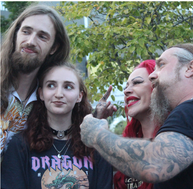
Spieler machen Selfies mit ihren Lieblingsdozenten

Nach der Verleihung der Awards hatten alle Teilnehmerinnen und Teilnehmer die Gelegenheit, Kontakte zu knüpfen und den Abend entspannt mit netten Gesprächen ausklingen zu lassen.