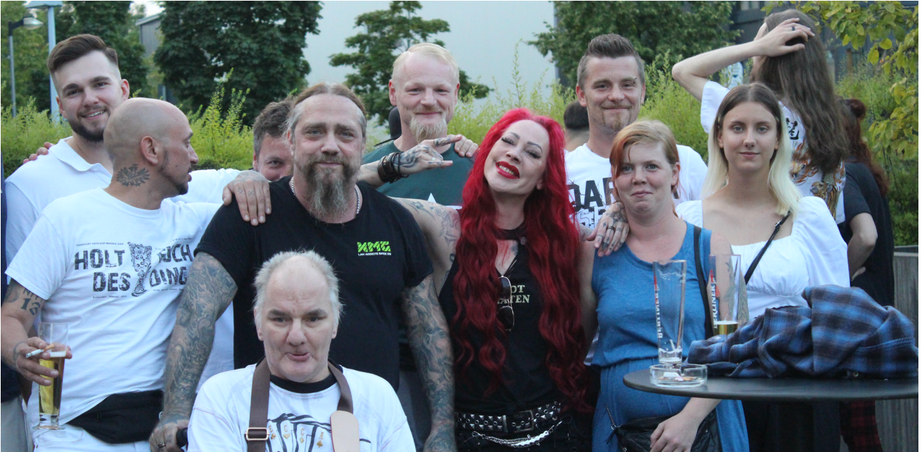
Die Spieler-Community trifft auf Dozenten und Mitarbeiter der Online-Spielotheken