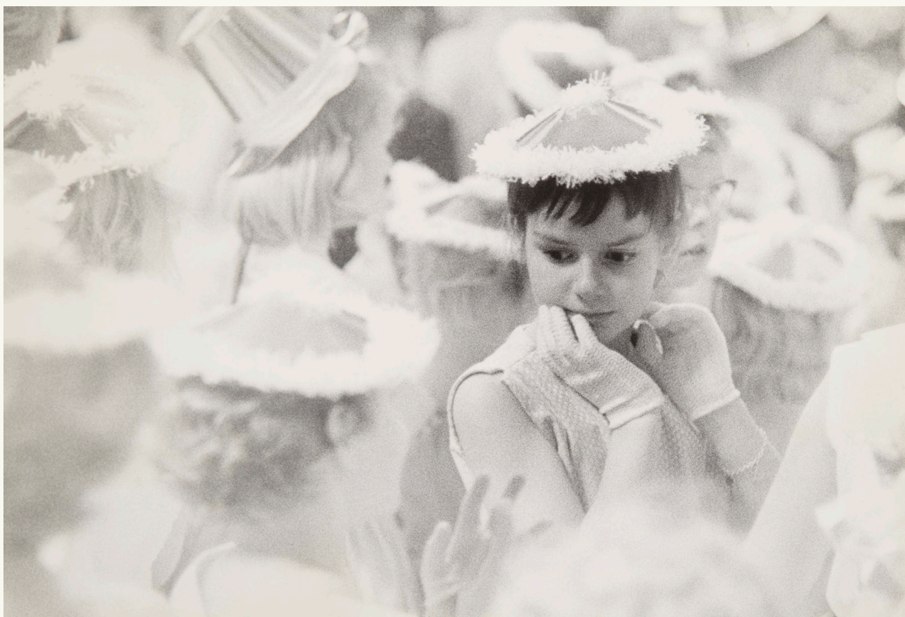
Svend Thomsen, Uden titel, 1960-69