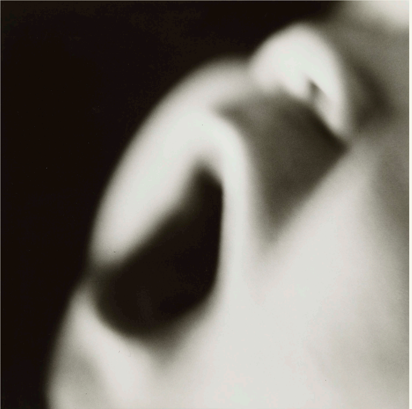
Tone Arstila, Uden titel / Different Family Pictures , 1988