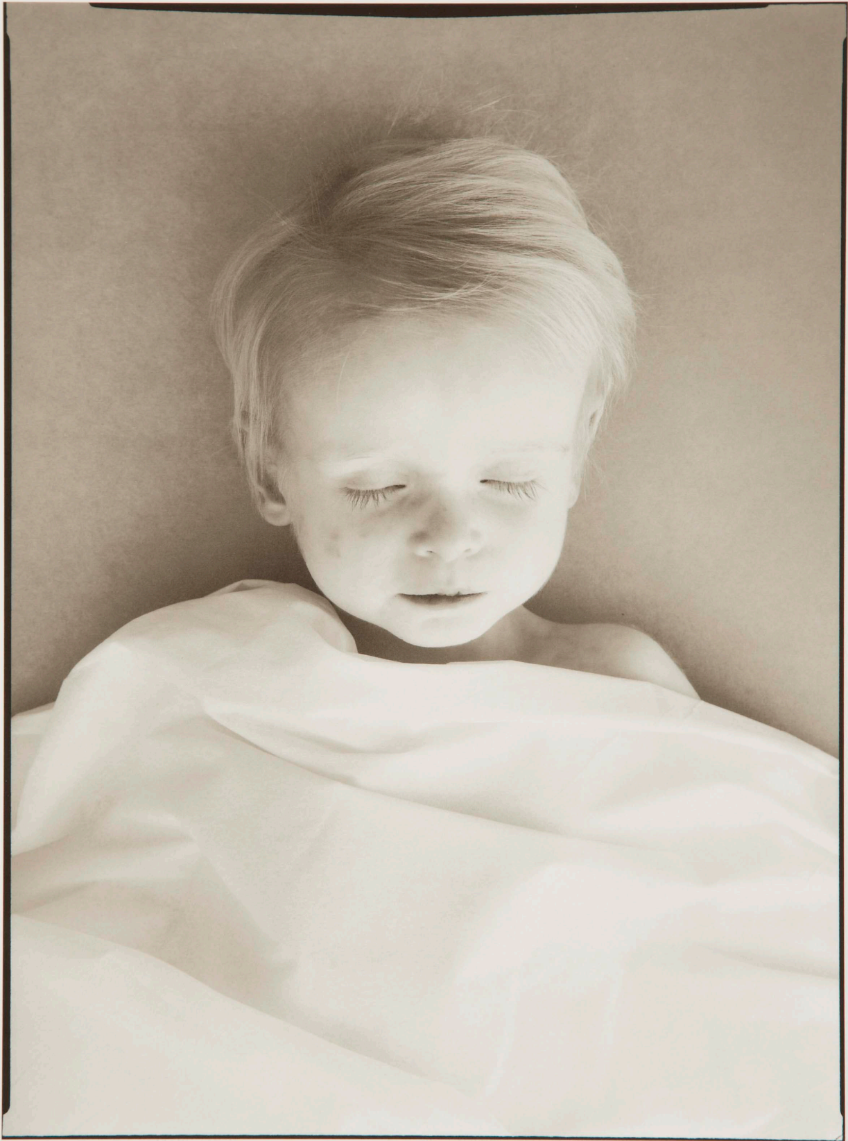
Rudolf Schäfer, Den evige søvn , 2008