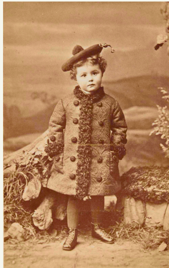
J. Jensen, Uden titel , u.å.; Ukendt fotograf, Uden titel , u.å.; H.F. Barby, Uden titel , u.å.; Victor Angerer, Uden titel , 1878.