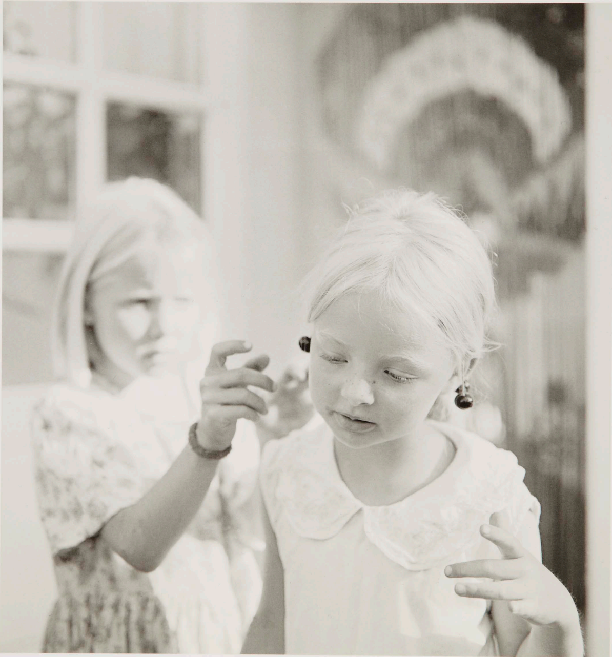
KIRSEBÆR I ØRET. 1995