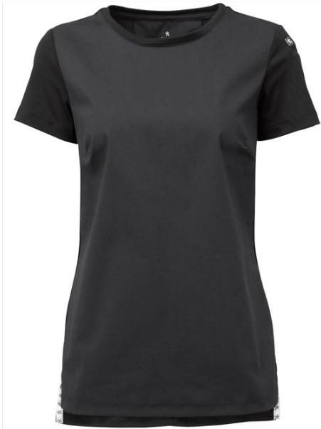
LILLI | 1120-BLK