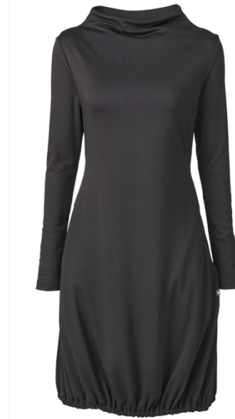
SOFIA | 1140-BLK