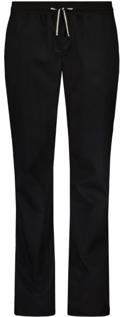
ELO | 2083-BLK