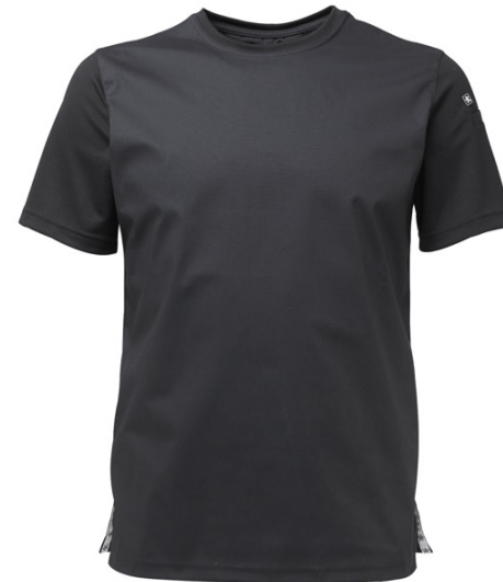
LOIMU | 1084-BLK