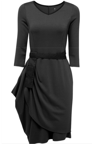
MILA | 1087-BLK