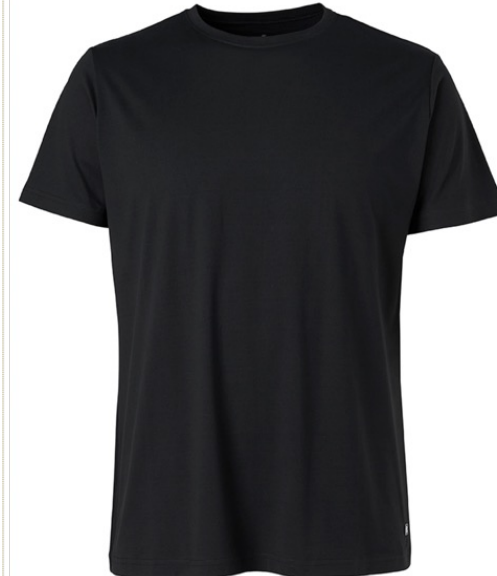
NINO | 3022-BLK