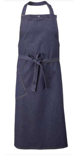
KIM | 7088-NVYDEN