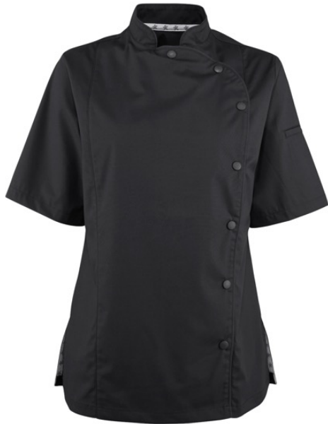
ELLA | 1039-BLK