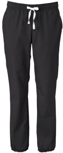
SASU | 2066-BLK