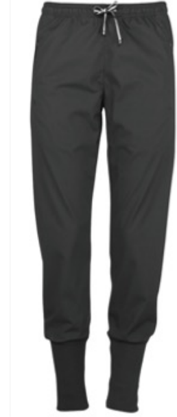
TUISKU | 2005-BLK