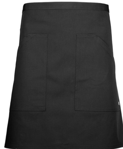
VENNI | 6035-BLK