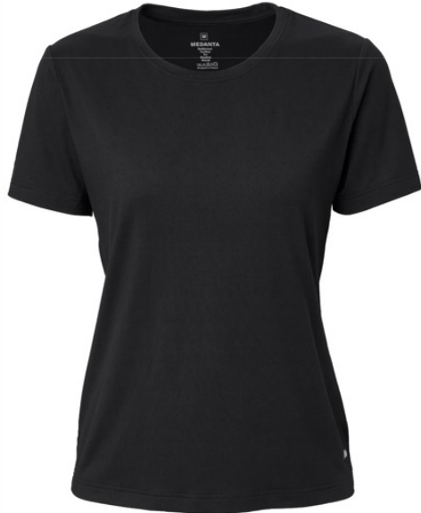
TITTA | 1157-BLK