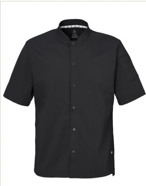
NIKO | 8042-BLK