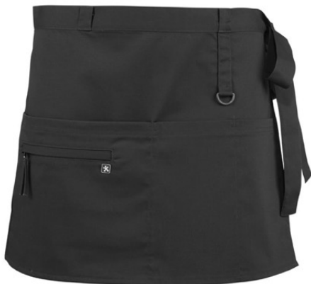
FRIDA | 6001-BLK