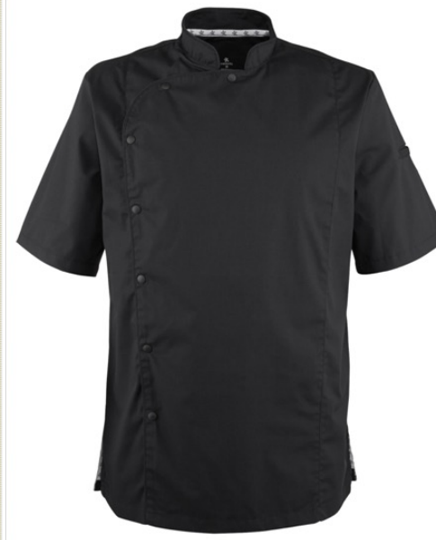
LUCA | 8009-BLK