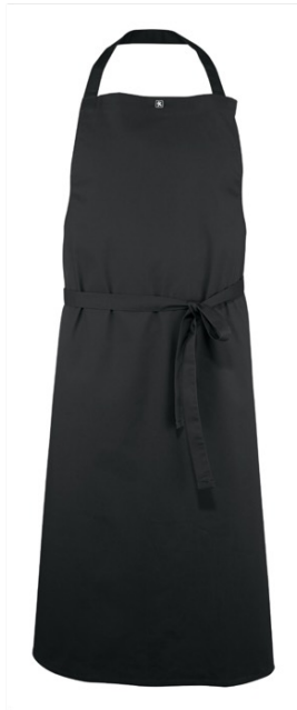
OLIVER | 7014-BLK