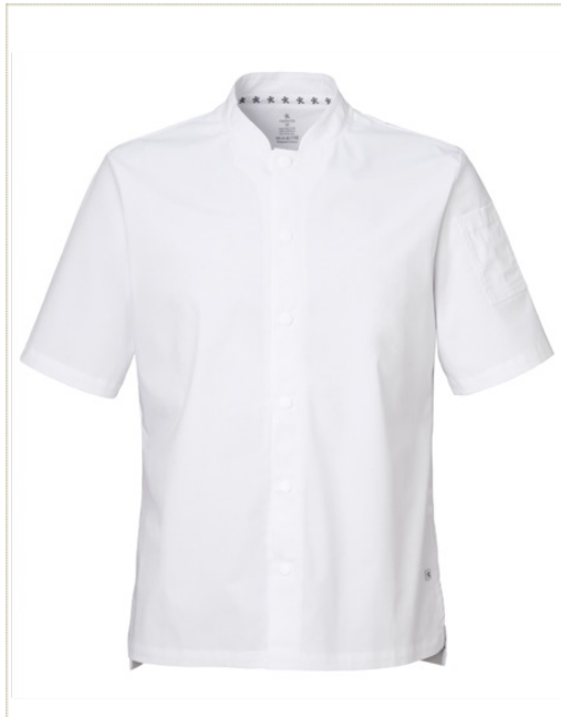
NIKO | 8042-WHT