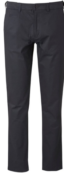
TUURI | 4006-BLK